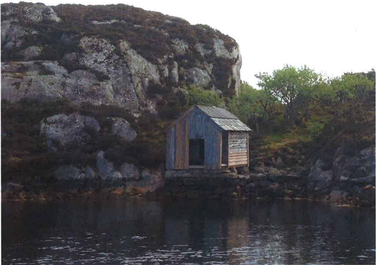
Notl o etter restaurering 2016