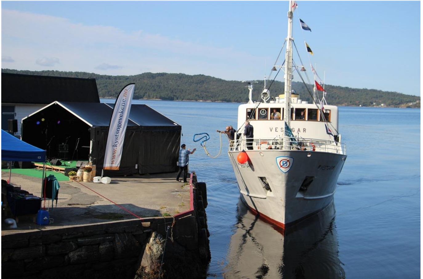
Ankomst Holmeknappen

Ein kortfatta rapport over rehabilitering som er utført på veteranbåten M/S "Vestgar" i 2017