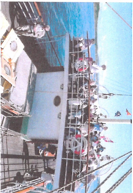
På tur i sol på fjorden.

Veterandampbåten «Stord I» har mange fine og interessante turar i seglingsseongen som strekkjer seg frå mai til september. Det er mange familievenlege opplevingsturar med avgang og retur til Holbergskaia/Bergen og turar i distriktet.