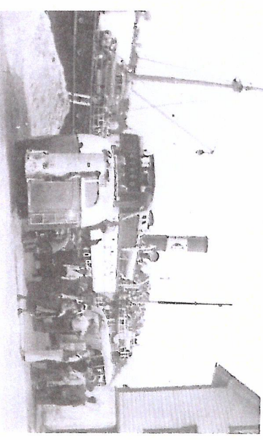
D/S Stord ved Tritelsnes under krigen.

I tidlegare tider, då folk ikkje hadde det så travelt, var det å «gå på kaien» eit viktig møte mellom by og bygd. Dette møtet vart varsla med dampskipa sine karakteristiske dampfløyter. Ringing i skipsklokka var signal om avgang til neste stoppestad.