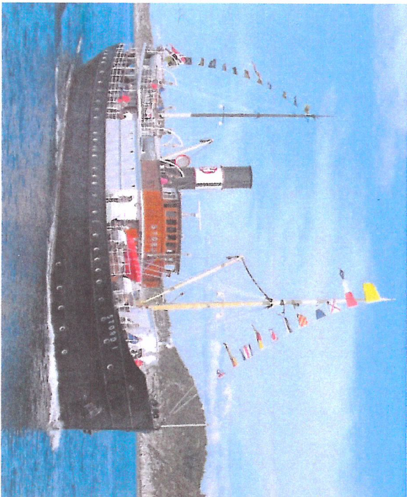
På tur frå Bekkjarvik.

Stiftelsen D/S Stord I eig «Stord I» og formålet til stiftinga er istandsetjing, vedlikehald og drift av skipet. Bergen er heimehamna. Seglingsfarvatnet er Vestlandet.