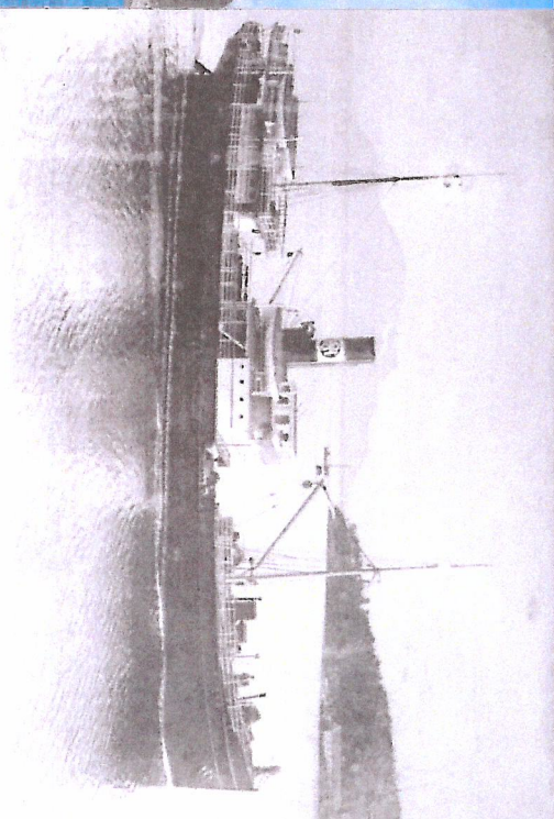
D/S Stord ved Leirvik.

Formålet med denne faldaren er å gi ei kort innføring i fjordabåtene/rutebåtene si historie og orientera om rutebåten/veteranbåten "Stord"/"Stord I" spesielt.