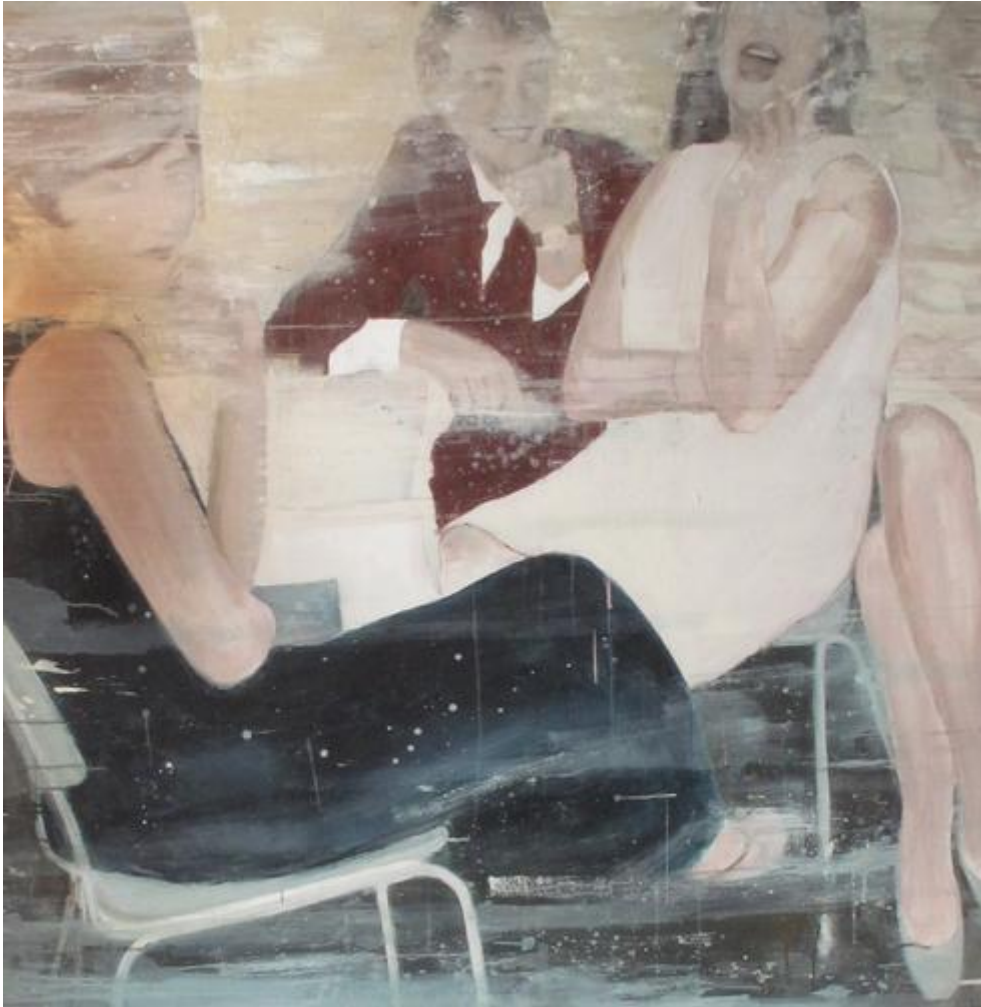
Kunstner: Marie Storaas