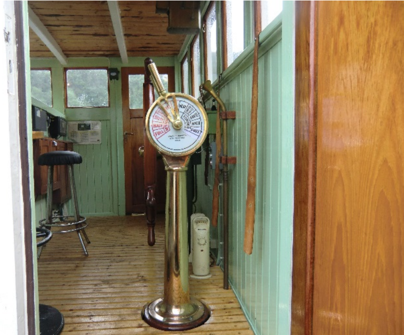
Ny maskintelegraf, brusøyla

DS OSTER har no fått ny maskintelegraf. Maskintelegrafen, maskinromsdelen, vart kjøpt på Møre og NHVL betalte ca. kr. 5.000 (dokumentasjon på denne utgifta kan ettersendast om nødvendig). Maskintelegrafen, brusøyla, gav me kr. 15.000 for og den vart henta i Drammen. Brusøyla var skada og det gjekk 60 timar med til reparasjonen og installasjon.