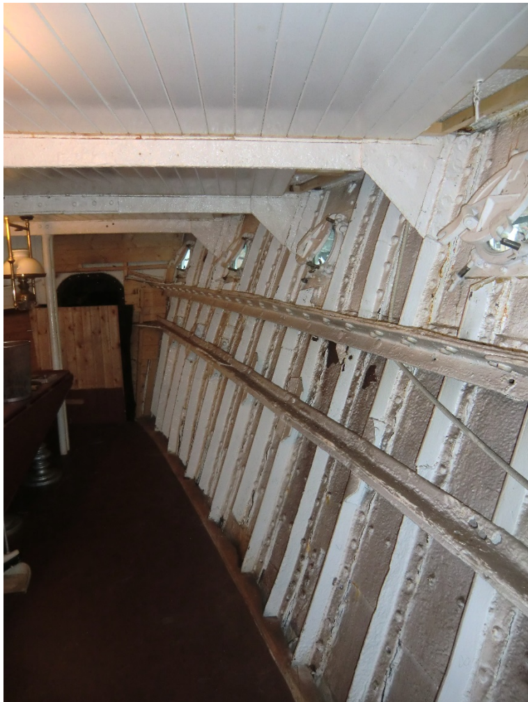
Reparasjon av stål i SB skuteside i forut 2 klasse salong