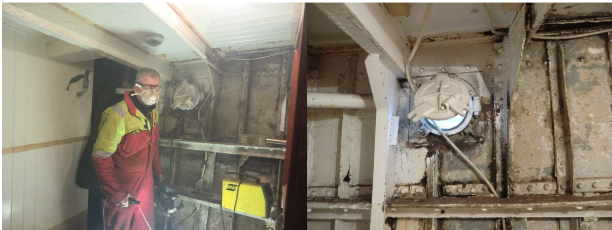
Reparasjon av stål i skuteside i lugarar BB side forskip.

Reparasjon av stål i skuteside i lugarar BB side forskip. Demontering av innreiing, fjerning av panel mot skuteside, og reparasjon av spant og hud etter behov. Maling etter ferdig stålarbeid, og tilbake montering av panel og innreiing. I tillegg held vi på og ferdigstiller tilsvarande reparasjon av stål i SB skuteside i forut 2 klasse salong.