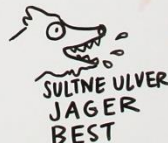
SULTNE ULVER JAGER BEST