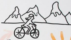
TOUR DE FRANCE

INTERESSEØKNING FOR EN MINDRE POPULÆR IDRETT: SYKKEL