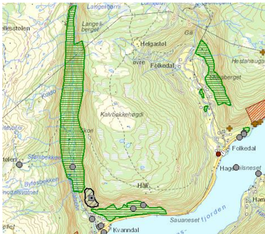
Figur 1: Kvanndalen – kart hentet fra Naturbase 2