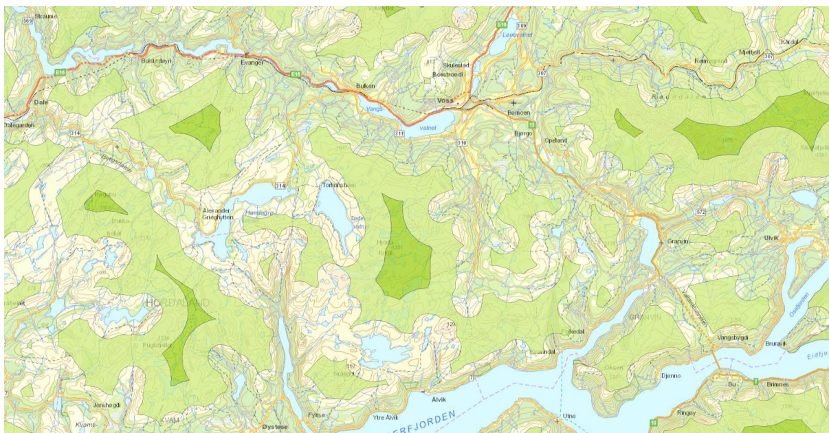
Figur 3: Kvanndalsgjelet og Kvanndalselva inngår i et større sammenhengende naturområde med urørt preg.

Kartleggingen og verdsettingen av landskapstyper i Hordaland har klassifisert Kvanndalsgjelet til «stor verdi» (NIJOS-standarden)(fig 4.). Tilgrensende områder har fått tildelt «Middels verdi», eksempelvis Granvinsfjorden. Vurderinger knyttet til konsekvenser for landskap er ikke tilstrekkelig utredet, og baserer seg ikke på eksisterende/ tilgjengelig data. I konsekvensvurderingen er tiltakets konsekvens satt til «ubetydelig». Dette er en undervurdering av temaet. Vi ber NVE sikre at temaet blir tilstrekkelig utredet.