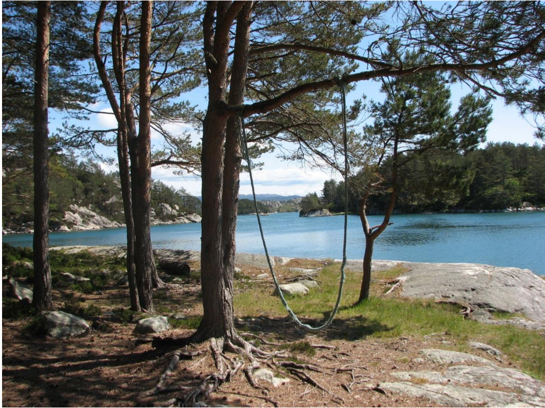
Parti fra Pilapollen, med ny flytebrygge nederst.