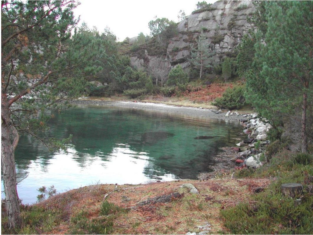
Fin badestrand på østsida av Pilapollen