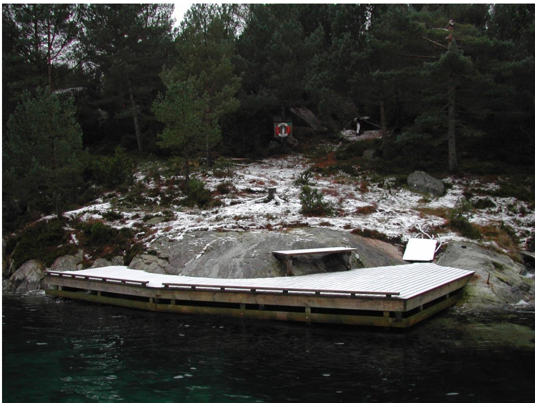
Vinterstemning på brygga som i sommersesongen har tett besøk