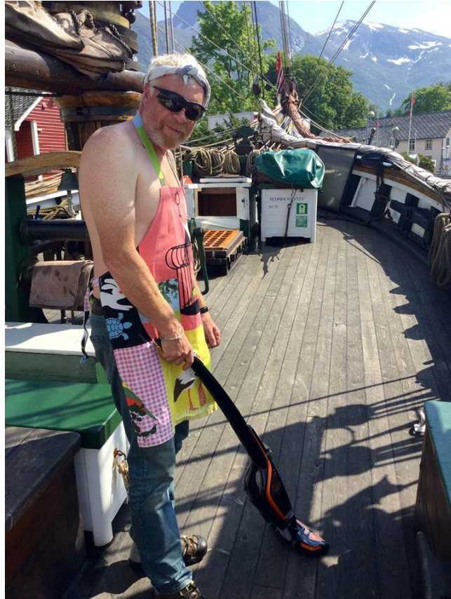
Skipperen i arbeid!

Skanseledning malt utvendig. Ankerklyss og halgatt er rustbanket og malt.