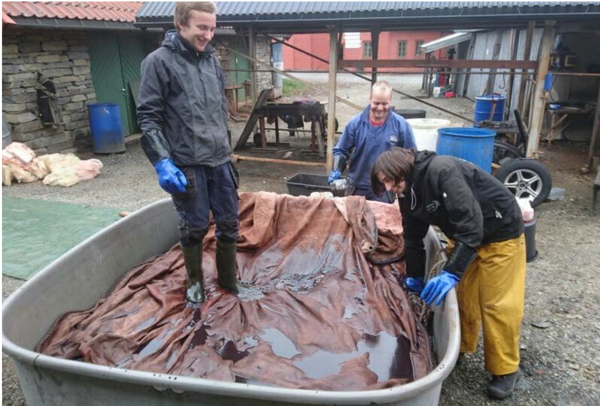
Mannskapet i arbeid med barkinga.

Alle segl ,utanom storseglet, vart barka denne hausten.