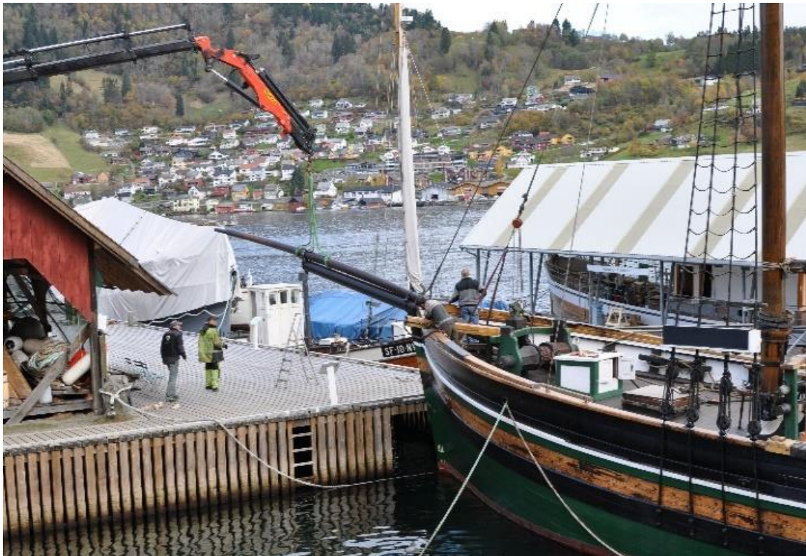
Gamle bommar vert heist på land.