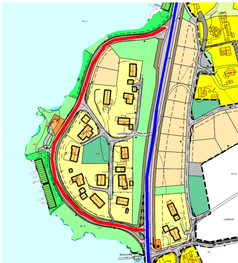
Figur 1: Blå strek = ny vegstrekning, raud strek = eksisterande vegstrekning