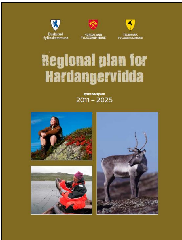
Figur 2. Forsiden på Regional plan for Hardangervidda 2011-2025

Fylkeskommunene Buskerud, Telemark og Hordaland gjennomførte i felleskap dette planarbeidet i perioden 2008-2011.