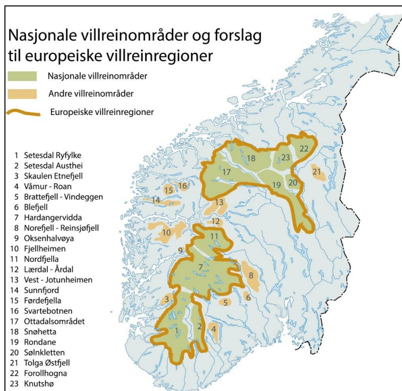
Figur 1. Nasjonale villreinområder

Slike regionale planer er etter hvert blitt utarbeidet for alle områder definert som «nasjonale villreinområder».