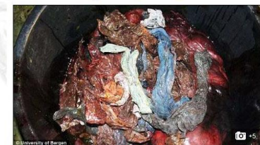
Researchers dissected the whale's stomach and found huge amounts of plastic, including over 30 plastic bags from Denmark and the UK

Despite the grisly findings, researchers say that the plastics found in the whale are 'not surprising', as the amount of waste in the seas continues to grow.