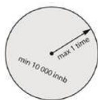
Figur 1.2 – Innbyggjarar skal kunne nå eit regionsenter innan ca. ein times køyring samstundes som regionsentera skal ha eit omland på minst 10.000 innbyggjarar.

Vi må ta hele Askøy i bruk, vi kan ikke trykke alt ned og omkring Kleppestø kaien. De planene som så langt er presentert vil ikke bidra til å løse Bergen sine boligproblemer. I disse planene snakkes om å bygge ca. 500 boliger i Kleppestø, dette monner ikke, dette blir pinglete i denne sammenheng. Skal Askøy bidra så må hele Askøy tas i bruk, vi har store områder rundt på øyen og vil nå ha en unik mulighet til å utvikle hele Askøy.