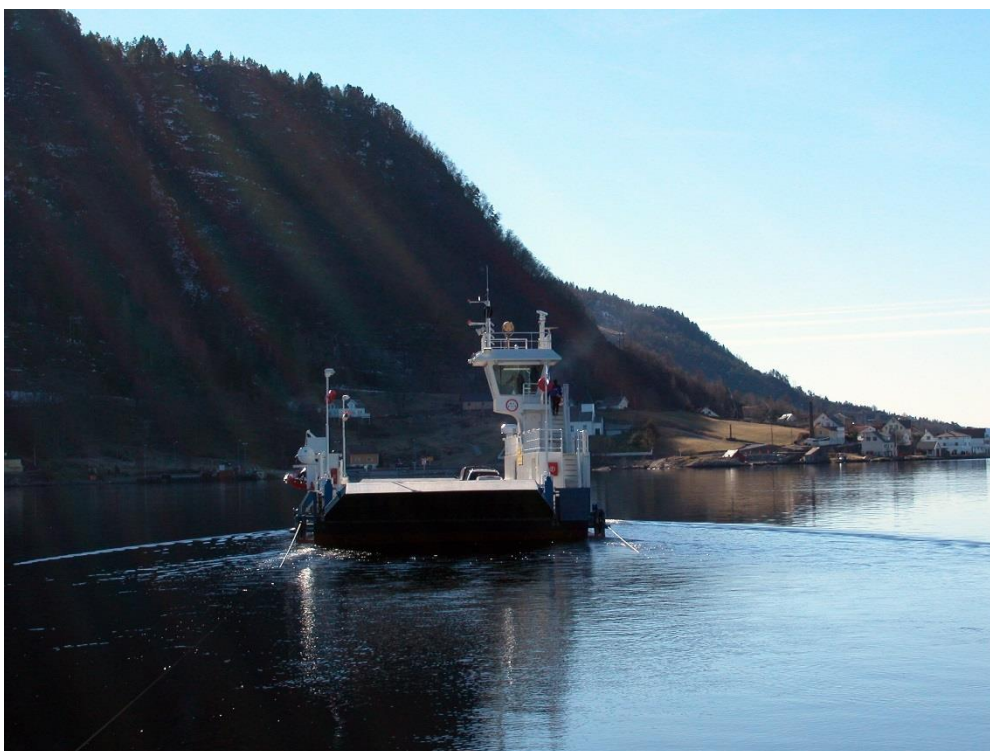
Figur 1: Kabelferjen Fjon–M på veg over Masfjorden.

Kommunehuset ligger på Masfjordnes ved fjordens munning, der kabelferjen Fjon–M ble satt i drift på ferjesambandet fv. 570 Masfjordnes–Duesund våren 2002. Ferjen kan frakte 21 personbiler, evt. to vogntog og 14 personbiler. I 2016 fraktet ferjen 158 kjøretøy per døgn over Masfjorden.