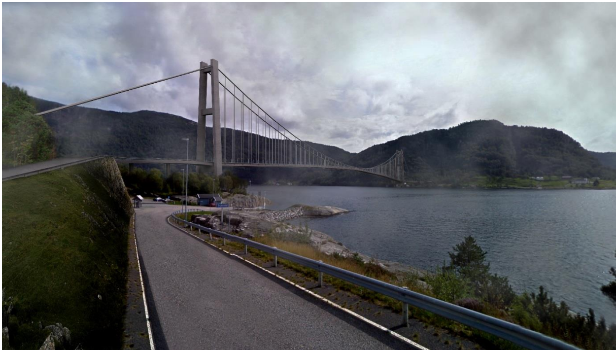
Illustrasjon: Masfjordsambandet sett fra Skarvetangen