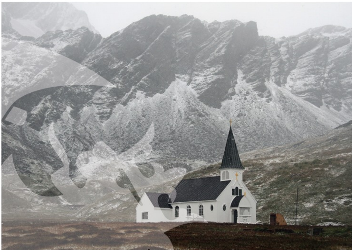
Gryviken kirke fra 1913, Sør-Georgia.