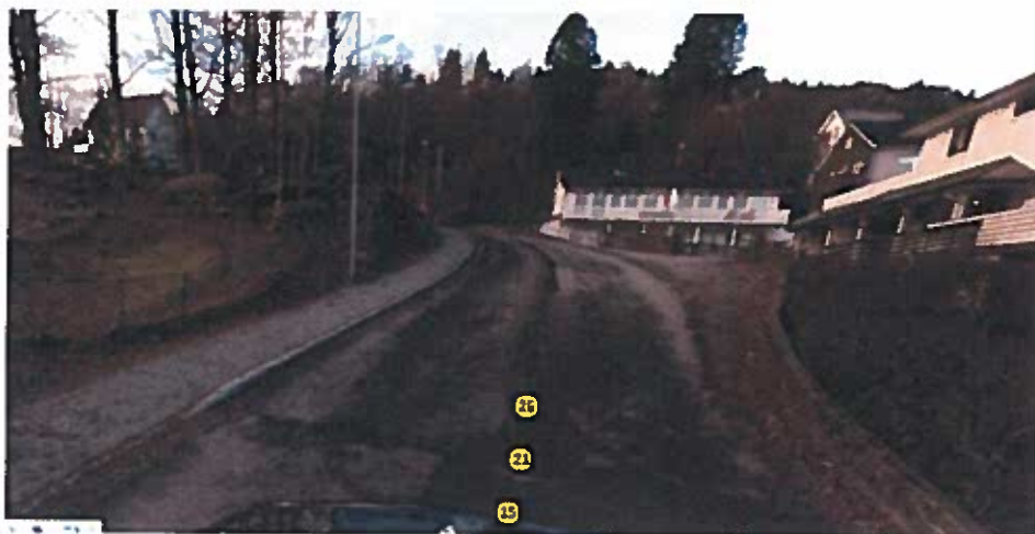
Sett fra øst