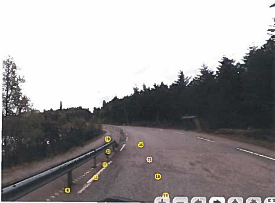
Fauskanger B & U