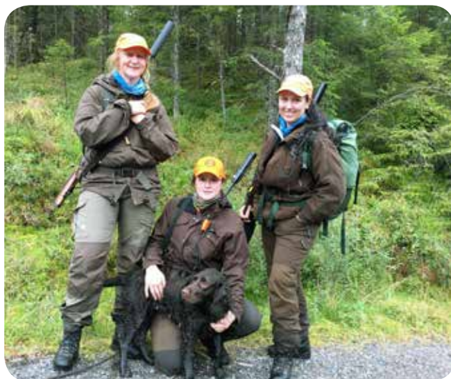
Tre av jegerne jaktet også på søndagen, her med Wachtelhunden Aidi. Artikkelforfatter til høyre.