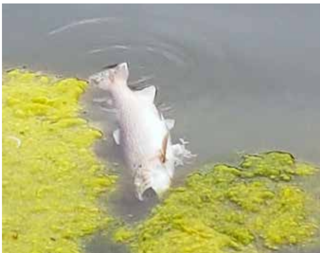
Død ørret i Lille Lungegårdsvann 04.august 2017.