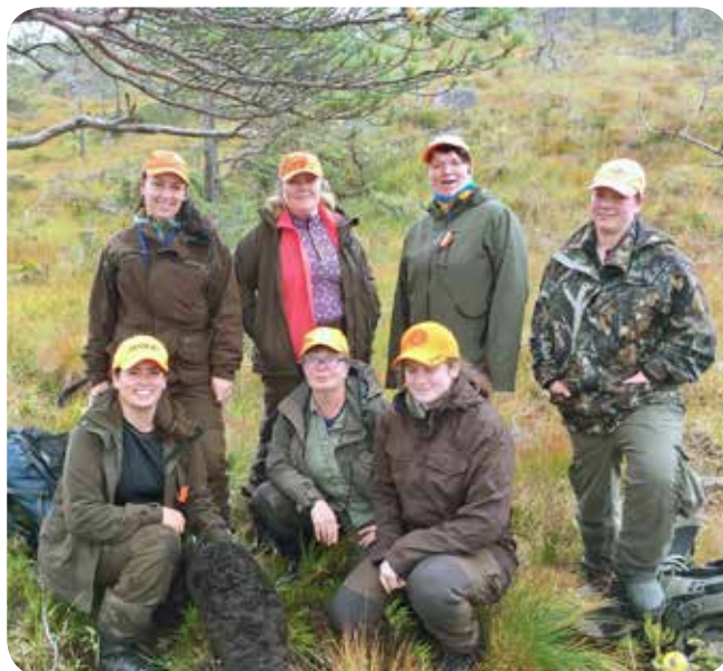
Syv fornøyde jegerjenter deltok på lørdagen.

Lørdag var vi totalt ti som var med: jaktleder, to hjelpere, to fra kvinneutvalget til NJFF-Hordaland og fem påmeldte til opplæringsjakten. Jaktleder var driver og vi andre ble plassert på post. I følge jaktleder var hunden i kontakt med dyr, men det ble ikke observert dyr på noen av postene i det første drevet. Når drevet var ferdig tok vi en velfortjent pause i fint vær. På andre drev på lørdagen var vi åtte som posterte og to som drev. Det gikk ikke lang tid før jaktleder meldte om et