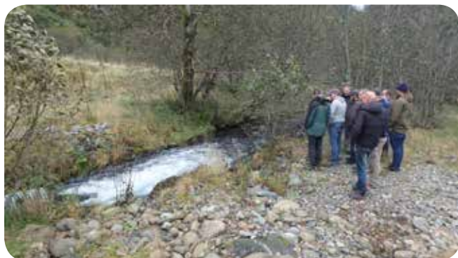
Deltagerne fikk en innføring i ulike fysiske tiltak som er gjort i sideløp og sidebekker til Daleelva.