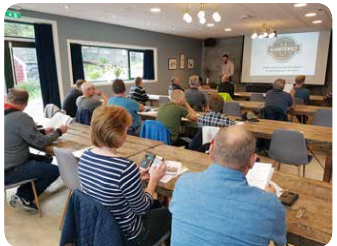
Kurslokalene som denne gang var hos Mandelhuset i Våge, var velegnet til formålet.