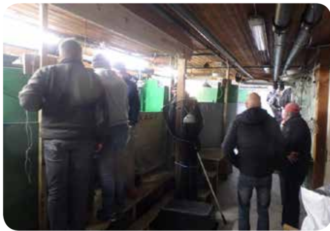
Kursdeltagerne fikk en grundig gjennomgang av aktivitetene på klekkeriet på Dale.