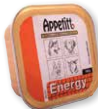
Appetitt Energy våtfôr, 150 gram

Appetitt Energy våtfôr kan gis direkte til hunden, gir rask energi og passer derfor utmerket til jakt, trening og hunder med høy ytelse.