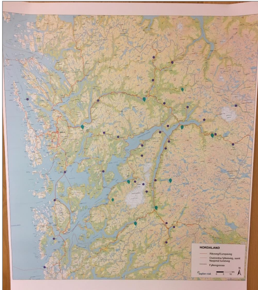
Figur 3-7: Lilla merker: sentrale stader. Grøne merker: Stader med utfordringar som skildra i tekstboks.