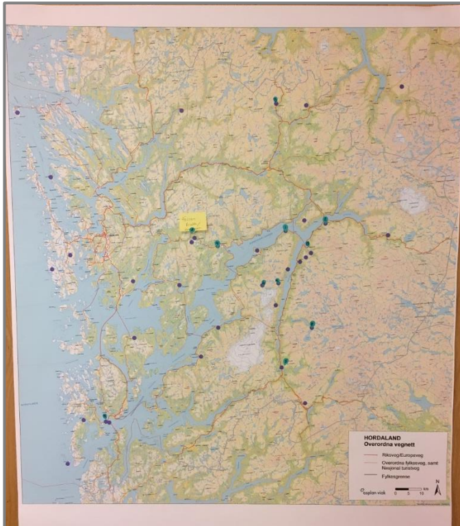
Figur 3-4: Lilla merker: sentrale stader. Grøne merker: Stader med utfordringar som skildra i tekstboks.