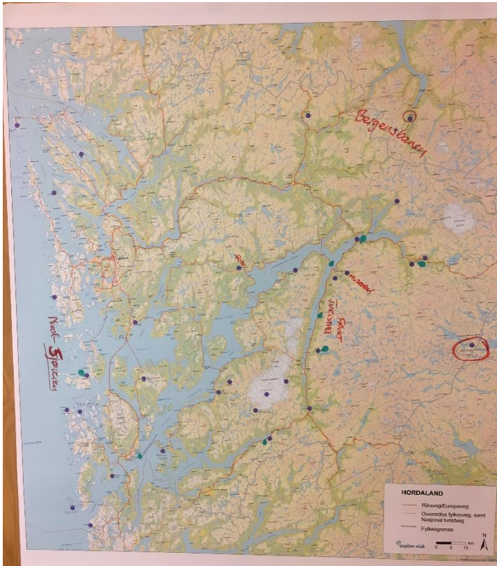
Figur 3-5: Lilla merker: sentrale stader. Grøne merker: Stader med utfordringar som skildra i tekstboks.