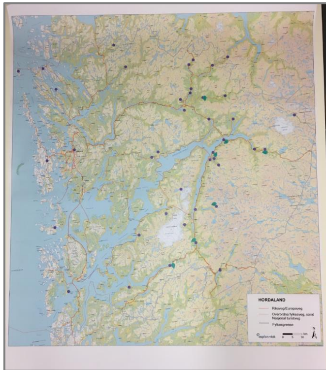
Figur 3-3: Lilla merker: sentrale stader. Grøne merker: Stader med utfordringar som skildra i tekstboks.