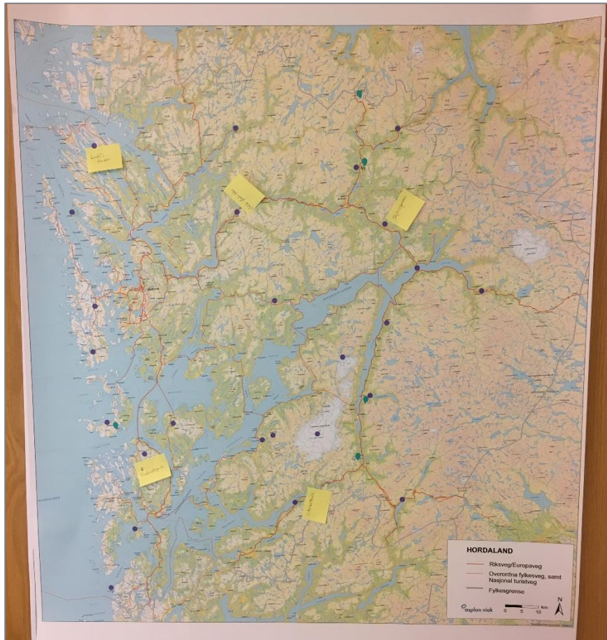
Figur 3-6: Lilla merker: sentrale stader. Grøne merker: Stader med utfordringar som skildra i tekstboks.