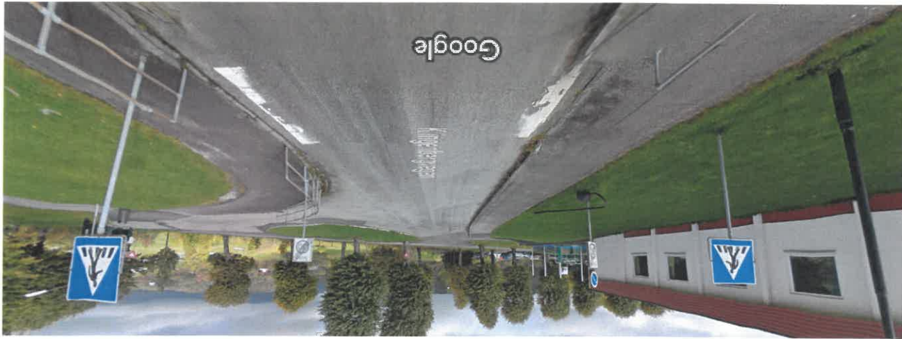
Bildet er tatt: okt. 2010