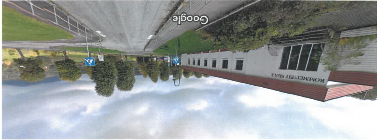
Bildet er tatt: okt. 2010