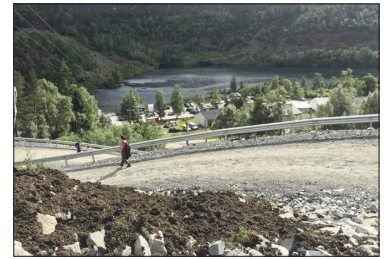
MÅGELIVEGEN: Hyppig brukt av turgådar.