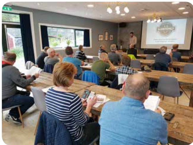
Kurslokalene som denne gang var hos Mandelhuset i Våge, var velegnet til formålet.