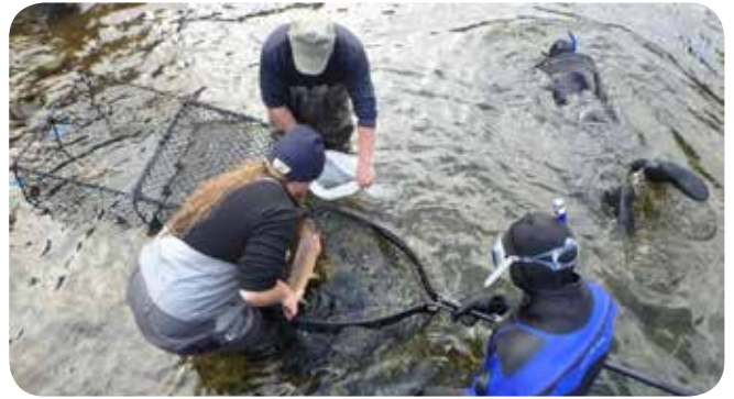
Deltagerne lærte eksempelvis om fangst av stamfisk ved bruk av dykkerdrakt og hov, og korttids oppbevaring av stamfisken i teiner.