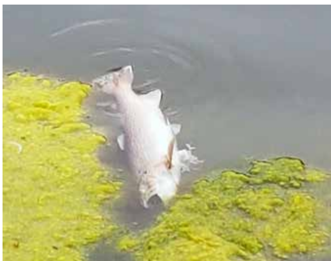
Død ørret i Lille Lungegårdsvann 04.august 2017.