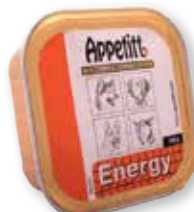
Appetitt Energy våtfôr, 150 gram

Appetitt Energy våtfôr kan gis direkte til hunden, gir rask energi og passer derfor utmerket til jakt, trening og hunder med høy ytelse.