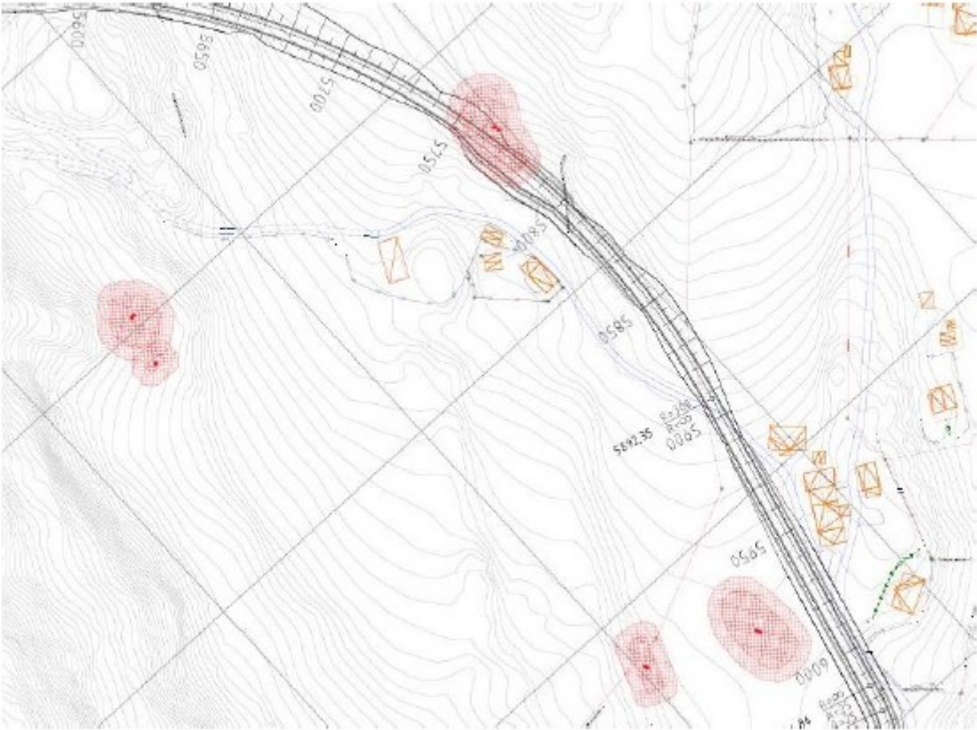
Figur 2-68 Utsnitt frå C011, ID 143890 på Usthus råkast.