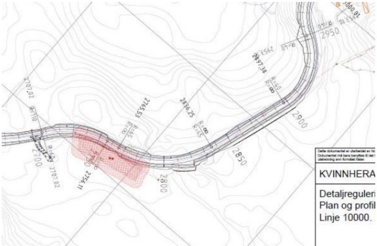
Figur 2-66 Utsnitt fra C006 og C007, ID 111936 på Nordhus råkast.

Kartutsnitt som syner konflikt mellom vegtiltak og kulturminne i reguleringsplan for Fjelbergsambandet, Kvinnherad kommune, Hordaland: