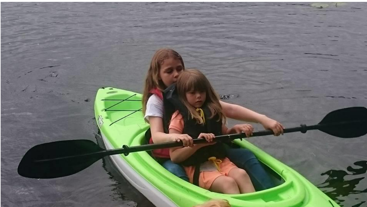
Kajakkpadling på Erdal

Vi har ca 15-20 barn og 4-5 voksne som møtes på Erdal barneskole eller ved angitt møteplass for den enkelte aktivitet, annenhver mandag. Vi har hatt både hallo-venn feiring, førstehjelpskveld, turbingo og kajakkpadling blant annet. Vi har også vårt eget tre opp mot Kolbeinsvarden som vi pynter til ulike høytider, til glede for alle som går tur. Nye fine frivillige er kommet til.