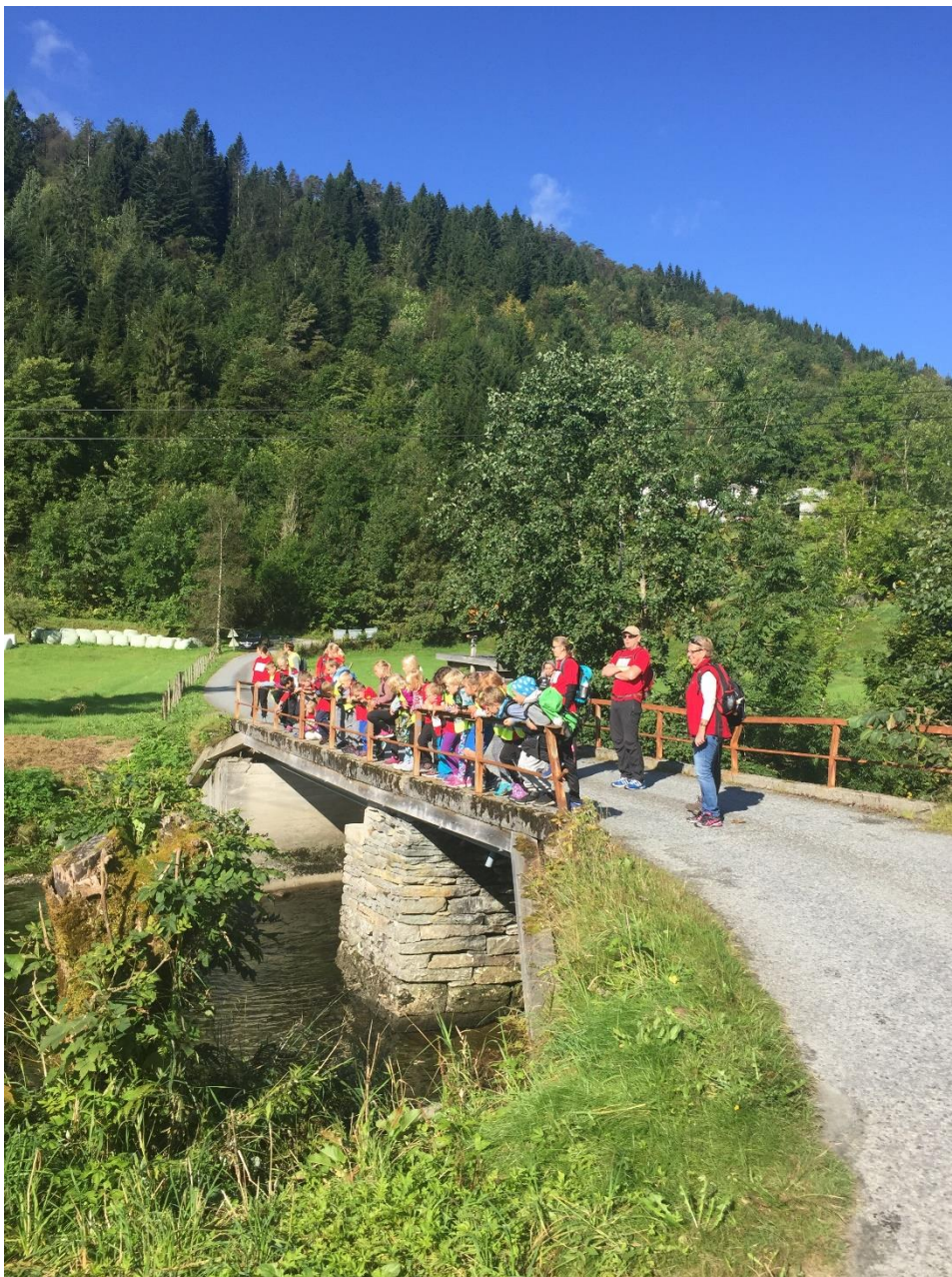
BARKERE på tur i vakre Strandebarm