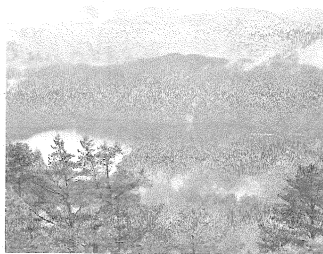
FIN UTSIKT: Det siste stykket fram mot toppen på Dyråsen får du fin utsikt over vatnet og Seimsfjorden (ikkje synleg på dette bildet).