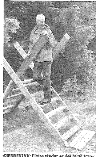
GJERDEKLYV: Fleire stader er det bygd trapper for at det skal vera lettare for turgåarar å koma fram.

folk alt har tatt den i bruk. Det er veldig kjekt, seier dei.