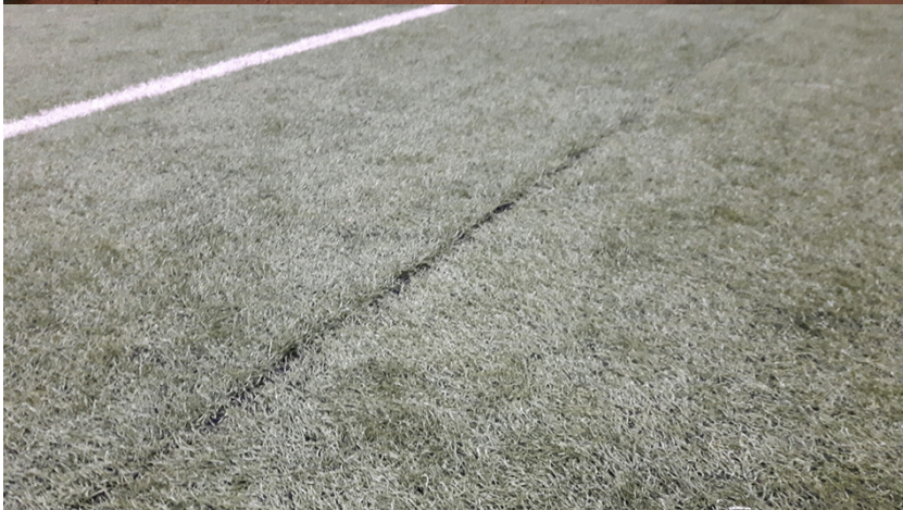
Skøter på grasmatte går opp i liminga