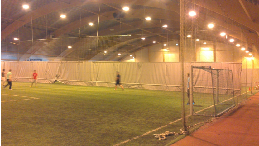
Lysanlegg, treningslys. Stadig behov for skifting av pærer.