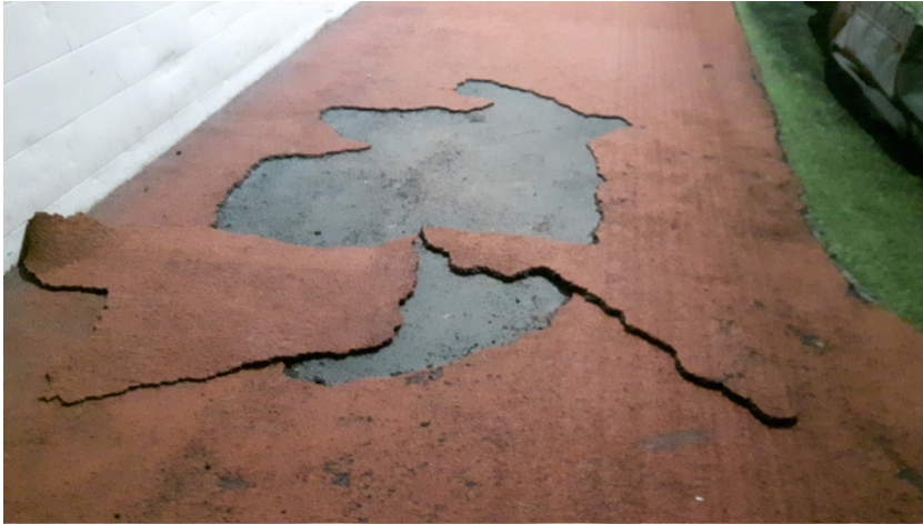
Løpedekke søndre kortsid