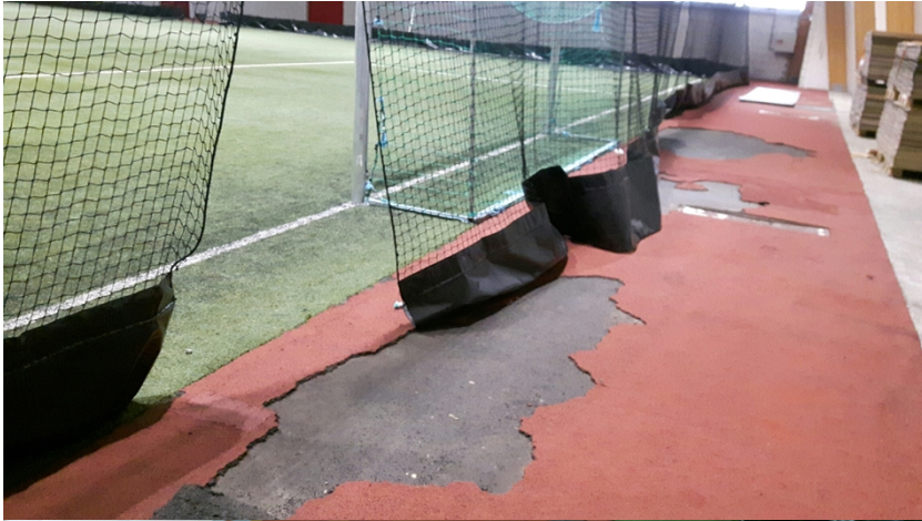
Løpedekke nordre kortside mot hoppegrop