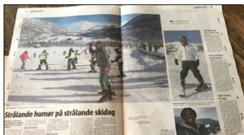
Avisoppslag etter skidagen i Avis Hordaland

22.februar i vinterferien 2017 inviterte Voss Røde Kors og Myrkdalen skisenter minoritetsskulebarn m/ foreldre til skidag. 90 stk. kom, av desse var ca 40 barn og unge. Myrkdalen dekka kostnadane denne dagen, Voss Røde Kors organiserte og hadde skiinstruksjon. I etterkant av denne dagen har mange kome med ynskje om å få læra meir skikøyring. Voss Alpint har no eit prosjekt på gang der dei ynskjer å tilby skikurs m. utstyr for barn og unge. Forhåpentlegvis får prosjektet midlar og kjem i gang i løpet av vinteren 2018.