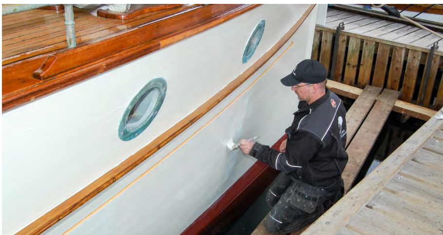
«Faun» males med linoljemaling slik det var opprinnelig. HFS.

Handverkeren som utfører arbeid på fartøyet, vil av og til se løsninger som kanskje ikke har vært kjent. I så fall vil det være viktig å dokumentere slike løsninger og la disse være styrende for restaureringsarbeidet. Viser dokumentasjonen at det har vært brukt bestemte løsninger er det disse som skal brukes, selv om de kanskje virker fremmede eller ikke er teknisk optimale.