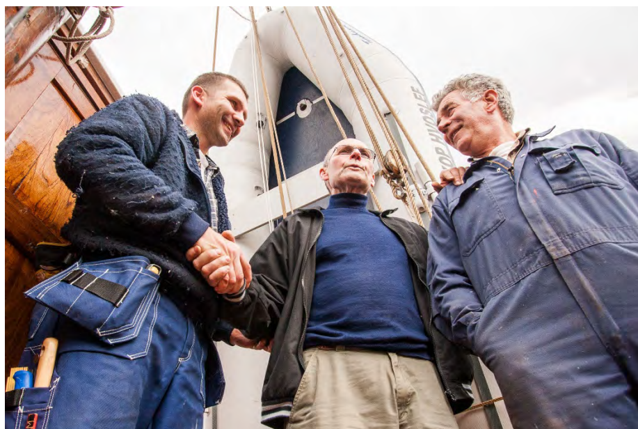
God kommunikasjon mellom verft og eier er en forutsetning for ei god restaurering. Eier må gjøre all historisk dokumentasjon tilgjengelig for verftet, samt være delaktig i beslutninger og føre dialog med Riksantikvaren.