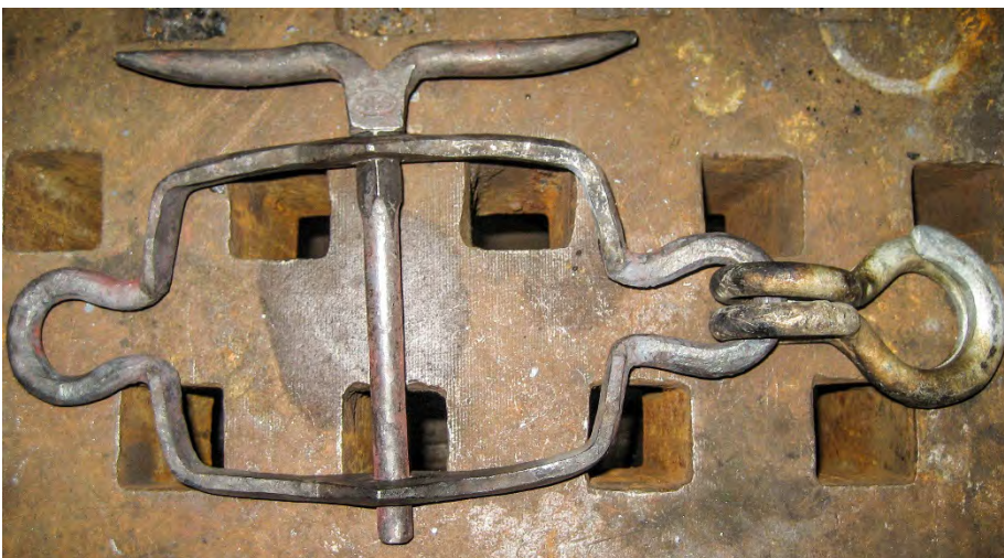
Smidde, fremfor sveiste beslag gjør en forskjell. Her et utvendig blokkbeslag. HFS.

Støpte og smidde deler skal støpes og smis, dersom deler skal kopieres. Det er ikke akseptabelt å sveise opp kopier av støpte og smidde deler. For å bevare gamle deler kan sveising være en aktuell reparasjonsmetode.