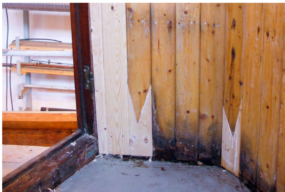
Et forsøk på å bevare mest mulig av de opprinnelige panelene i styrhuset på «RS Biskop Hvoslef». Råteskadde deler er byttet ut med frisk materiale av tilsvarende kvalitet. NNFA.

Jo mer av dokumentasjonen som er på plass før et prisoverslag blir utarbeidet, jo mer treffsikkert blir overslaget. Her har alle parter en felles interesse i å få størst mulig forutsigbarhet. Etter at demonteringsprosessen har kommet i gang bør en derfor lage et overslag ut fra det omfanget som da viser seg. Demontering bør altså også ha som mål å avdekke fartøyets tilstand i størst mulig grad.