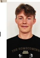
og en stor takk til Egil Furnes