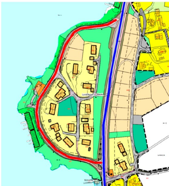
Figur 1: Blå strek = ny vegstrekning, raud strek = eksisterande vegstrekning