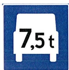
506 Tungtrafikkfelt (Eksempel)

På denne bakgrunn foreslår vi å innta følgende nye skilt og tekst i kapittel 6 Opplysningsskilt § 12 som skilt 506 Tungtrafikkfelt og skilt 507 Slutt på tungtrafikkfelt: