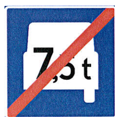
507 Slutt på tungtrafikkfelt (Eksempel)

Kjørefelt for motorvogn med tillatt totalvekt høyere enn angitt. Feltet kan også brukes av uniformert utrykningskjøretøy. Skiltet angir at kjørefelt for tungtrafikk begynner. Skiltet gjelder fram til skilt 507 «Slutt på tungtrafikkfelt» eller til første vegkryss. Skiltet oppheves også av vegvisningsskilt som angir annen bruk av feltet.