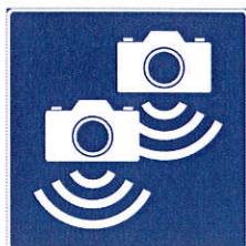
556.2 Automatisk trafikkontroll – strekningsmåling

En brukerundersøkelse har vist at dagens skilting av streknings-ATK ikke fungerer godt nok, blant annet at flere ikke forstår forskjellen på en strekningsmåling og en punktmåling. Det er en stor utfordring å formidle et så vidt komplisert budskap på et skilt, da man er nødt til å begrense informasjonsmengden slik at skiltet kan oppfattes i fart. Forbedret skilting er trolig ikke tilstrekkelig, informasjon om tiltaket må nok generelt sett også forsterkes i ulike kanaler. Vi mener imidlertid det er grunn til å gjøre skiltingen av streknings-ATK bedre, slik at denne på en tydeligere måte skiller de to kontrollmetodene fra hverandre. Vi foreslår derfor å innta følgende nye skilt i kapittel 6 Opplysningsskilt § 12 som nytt skilt nr. 556.2: