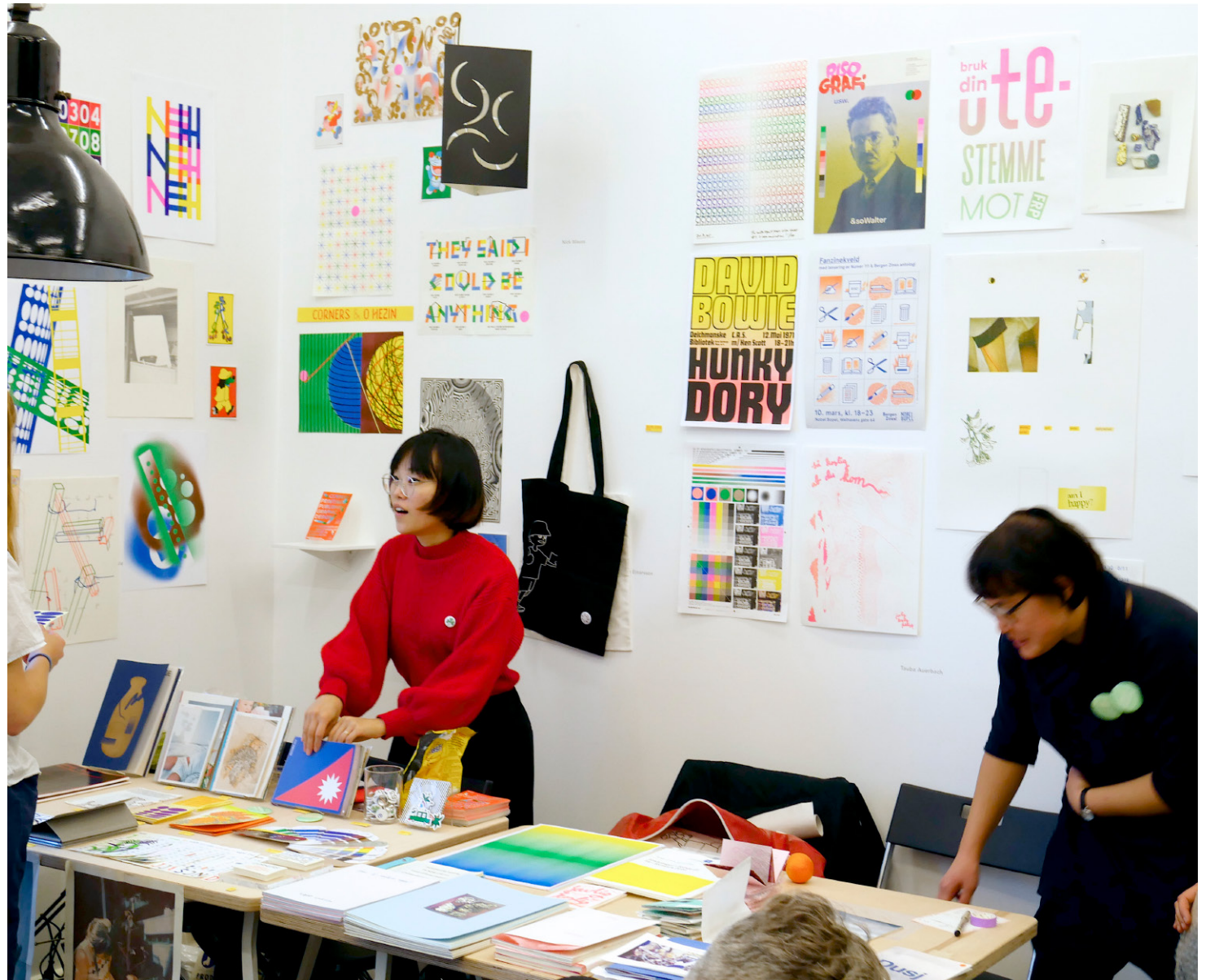
PÅ STAND: O HEZIN, CORNERS, HVERDAG BOOKS OG NORSK RISOGRAFFORENING