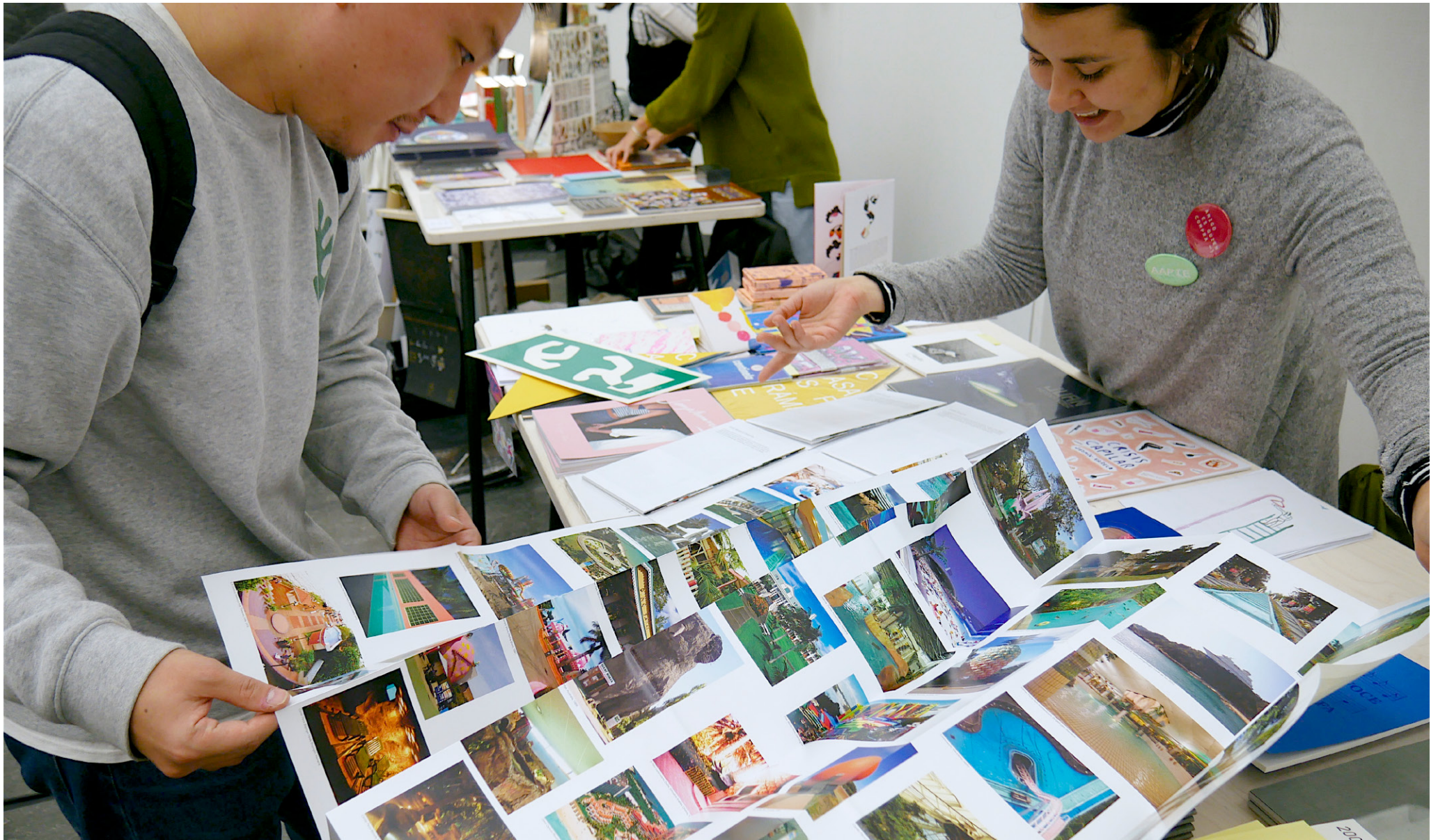
BERGEN ART BOOK FAIR 2017 SAKSNR. 2017/857