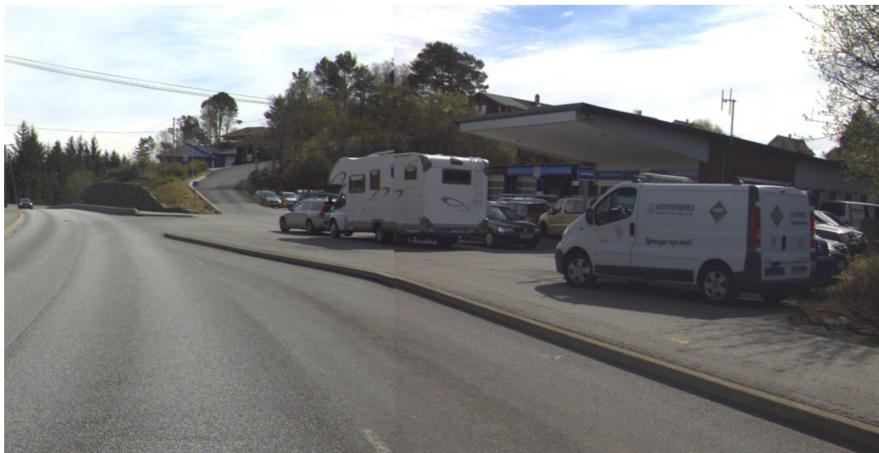
FV233 HP 1 Km 1,130 – mai 2017