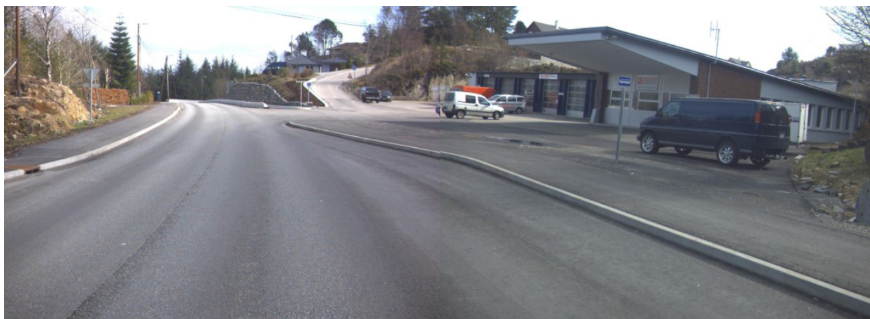
FV233 HP 1 Km 1,130 – april 2011.

Vegutbedringsplanen viser ikke frisikt i henhold til gjeldende krav jfr. N100. Planen viser derimot et avkjørselspunkt som er mer definert enn det som i etterkant er blitt opparbeidet. (ca. perioden 2010/2011). Avkjørselen slik den ligger i dag oppfyller ikke gjeldende tekniske krav til uforming og avkjørselspunktet fremstår som utflytende. Vegbilder fra perioden 2011 frem til i dag indikerer også at bruken av arealet foran verkstedet har økt i omfang.