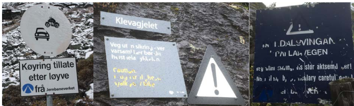
Skilt som skal bytast ut. Forbudsskilt ved Stururdi til venstre, varselkilt ved Klevagjelet i midten og varselkilt ved Myrdalsvingane til høgre.