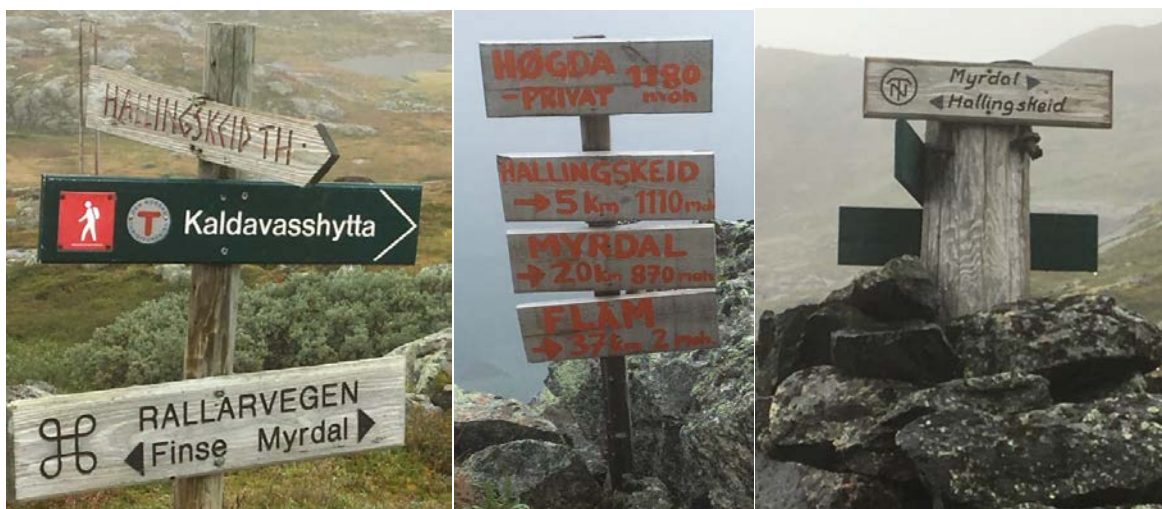
Døme på eksisterande retnings-/avstandsskilt langsmed traséen, strekninga Finse-Flåm.

Hausten 2017 vart det gjennomført ein ringerunde til instansar og føretak med interesse i/for Rallarvegen, der eitt av spørsmåla var: dersom interessenten kunne velje ein ting som han/ho ville fått gjort eller endra på i samband med Rallarvegen, kva skulle det vere? Svaret på dette spørsmålet var i stor grad at ein ønskte å få satt opp skilt som viste avstandane på strekninga generelt, og avstand til næraste rasteplass, overnattingsstad, toalett og liknande. Slike skilt skal difor prioriterast i formidlingsarbeidet. I tillegg skal varsel-/forbudsskilt bytast ut på fire (fem) stader. Skilta skal vere på plass til sesongen 2018.