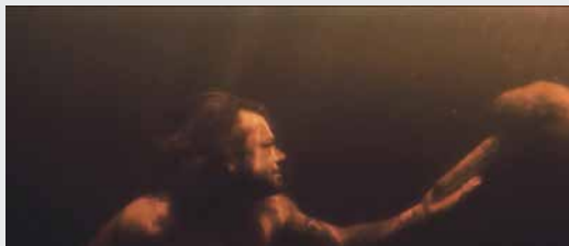
Colombia, USA 2017 | Regi: Mark Grieco | 1 t. 26 min. | S: spansk/engelsk/portugisisk | U: delvis engelsk | Klimafestival

FRE. 29. SEP 17:45 TIV LØR. 30. SEP 17:00 MB1 TIRS. 03. OKT 16:25 TIV