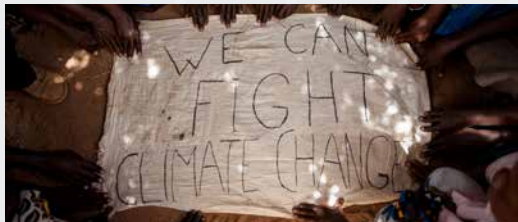
Norge, England 2017 | Regi: Julia Dahr | 1 t. 30 min. | S: swahili/engelsk | U: engelsk | Norsk dokumentar - Konkurransen | Klimafestival

The fight for the environment is a tough battle, and the resistance is powerful. How far should we go to save an endangered species?