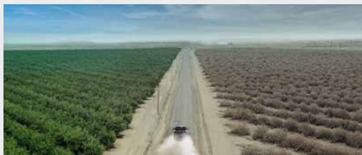
USA 2016 | Regi: Marina Zenovich | 1 t. 27 min. | S: engelsk | U: utekstet | Checkpoints | Klimafestival

Big game hunting – friend or foe? Unravelling the hidden connections and surprising paradoxes in the conservation of endangered species.