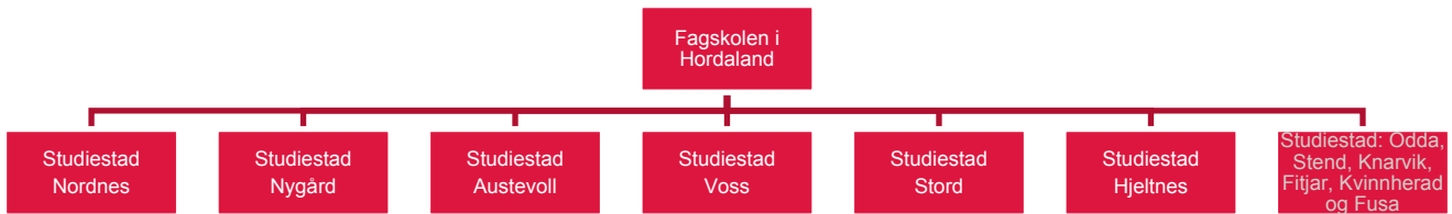
Figur: Organisasjonskart for Fagskolen i Hordaland

Studiestader med grå tekst er godkjente, men ikkje aktive.