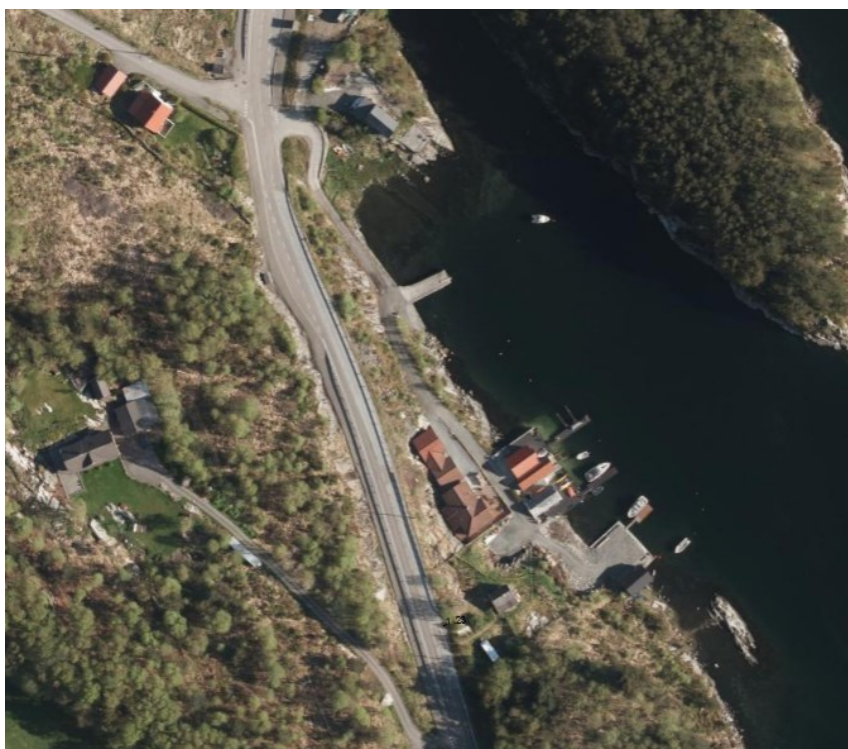
Aktuell tomt like nord av skogsområde på austsida av Fv 555

Vi ser at Hilleren prosjektering viser til dialog mellom tiltakshavar og Statens vegvesen om eventuell oppføring av ny hytte på gbnr 11/59. Vi har sagt at vi kan vurdere å akseptere ny hytte på staden i same distanse som eksisterande hytte har. Vi vurderer det som logisk at ein i dette tilfelle kan etablere ny fritidsbustad der det allereie står ein i dag. Dette samsvarer med vår handsaming av bustadhuset på Børnes gbnr 10/2, nemnd ovanfor.