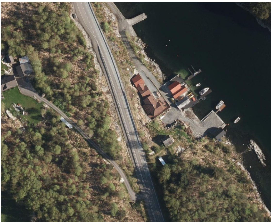
Omsøkt tomt på gbnr 11/59, på høgre side av Fv 555 med eldre hytte og campingvogn