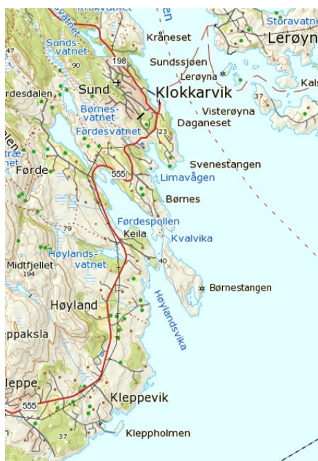
Aktuelt område gbnr 11/59 på vestsida av Førdepollen i Sund kommune

Byggjegrænse for Fv 555 er på 50 meter, jfr § 29 i Veglova. Rammeplan for avkøyrsløse og byggjegrænser i Region Vest legg også til grunn ei byggjegrænse på 50 meter. Fylkesvegen er lagt inn i haldningsklasse 2, gul sone. Eigedomen ligg soleis allereie innanfor byggjegrænse til Fv 555. Statens vegvesen har oppfordra søkjar til å finne alternativ plassering av bustad i ein distanse på minimum 30 meter. Med dette har ein allereie gjeve ein dispensasjon på 20 meter. Søkjar har først stått fast på ein distanse på 15 meter. Deretter ved revidert søknad har tiltakshavar endra plassering til 26 meter. Med bakgrunn i gjeldande regelverk og vurdering av den trafikale situasjonen på staden avlo vi først søknaden 13.12.16 og deretter revidert søknad 02.10.17. Statens vegvesen mottok klage på vårt forvaltningsvedtak 10.11.17.