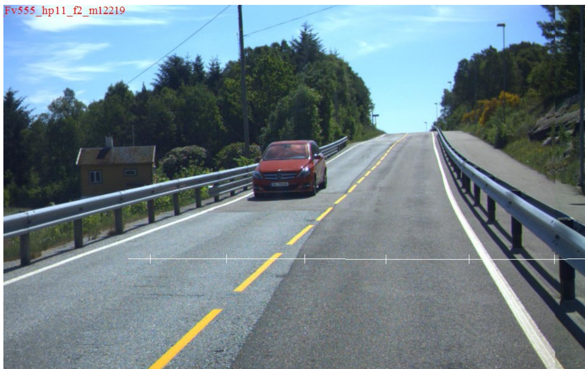
Gbnr 11/59 med påståande eldre fritidsbustad ved Fv 555, mot sør.

Fv 555 går frå Skogsskiftet til Kleppe via omsøkt område i Førdepollen og endar opp i Klokkarvik i Sund kommune. Forbi den aktuelle tomte går vegen i rett strekning over eit høgbrekk (sjå foto under). Døgntrafikken på Fv 555 på staden er opp mot 1500 biler. Fartsgrensa på staden er skilta til 50 km/t, men truleg er nok det reelle fartsnivået noko høgare, med ei rett strekning over eit lengre parti som innbyr til høgare fart.