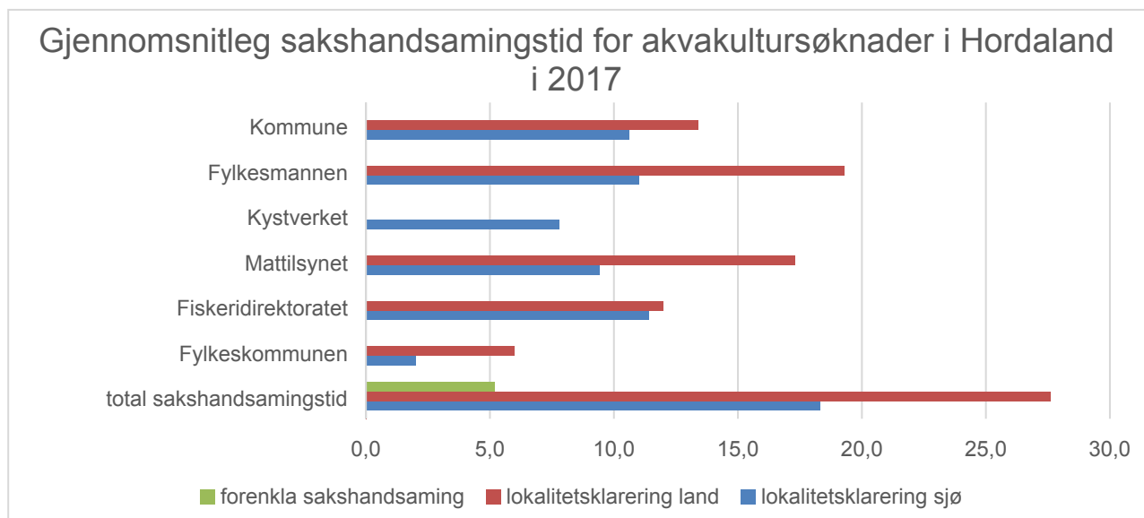
Figur 3 gjennomsnittleg sakshandsamingstid for dei tre kategoriane av saker fordelt på dei ulike etatane

Figur 3 viser sakshandsamingstida samanlagt, og fordelt på den enkelte myndigheit, for alle tre kategoriane av saker. Vi ser at søknader om landbaserte anlegg tar totalt i gjennomsnitt 9 veker lengre tid å handsame enn søknader om sjøbaserte anlegg. Desse søknadane tar lengre tid hos både kommunen, fylkesmannen, mattilsynet og fylkeskommunen. Når det gjeld søknader på sjøbaserte anlegg klarar alle etatane stort sett å holde seg innanfor sine forskriftsfesta tidsfristar.