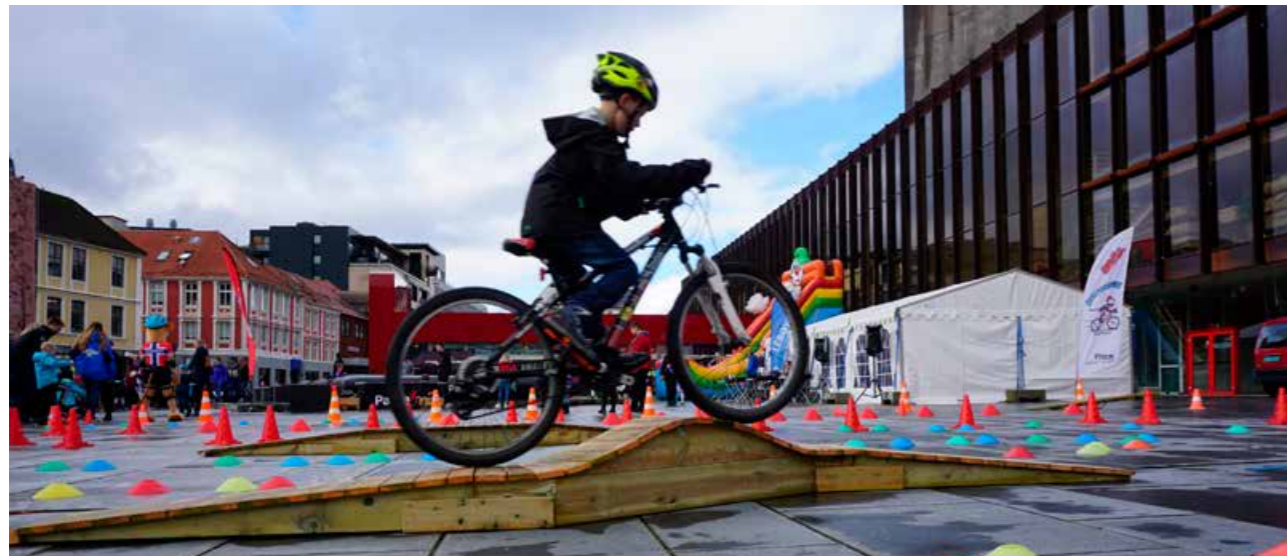
Opplæringsprogrammet «Alle barn sykler» har vore gjennomført på til saman 54 skular i Hordaland i 2017, der i overkant av 2700 elevar har fått praktisk trafikkopplæring. Samarbeidet med NCF om trafikkopplæring held fram i 2018.

Hjertesone-arbeidet vil også setja omfattande krav til arbeidet vårt vidare. Bergen bystyre har vedtatt at alle barne-skulane i kommunen skal ha ei definert Hjertesone kring skulen sin, at skulane skal vera pådrivarar for at fleire går og sykklar, og at alle skular har ein eigen trafikksikringsplan med risikovurdering og tiltak. Prosjektleiaren i Trygg Trafikk vil ha som sentral oppgåve å støtta Bergen kommune i dette arbeidet, saman med andre viktige samarbeidspartnarar som Statens vegvesen og Hordaland fylkeskommune. Samtidig vil prosjektleiaren ha høve til både å setja seg inn i arbeidet med Trafikksikker kommune og å støtta eventuelle andre skular i Hordaland med innføring av Hjertesone-prinsippa. Det systembaserte arbeidet som ligg i Hjertesone og Trafikksikker kommune, har openberreligskapstrekk, og prosjektleiaren vil difor ha nytte av å sjå samanhengar og å jobba for å setja desse ut i livet.