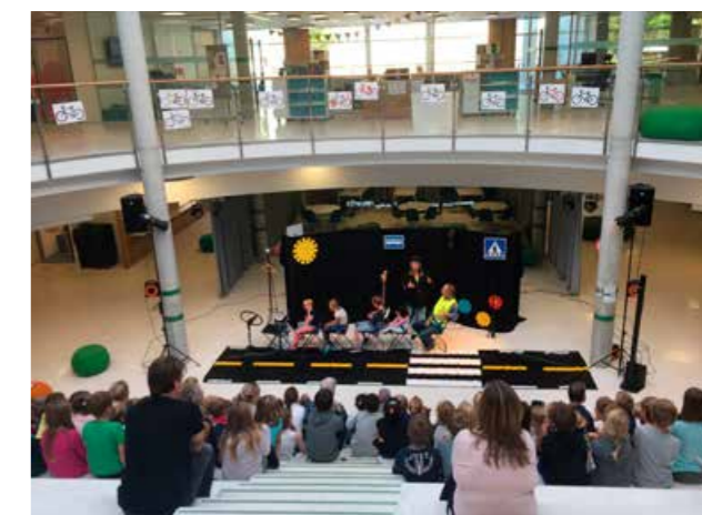
Trafikkteateret «Ville veier og vrangt skilt».

I løpet av 2017 gjennomførte me lærarkurs i januar og februar, med særleg merksemd kring trafikkopplæring i grunnskulen.