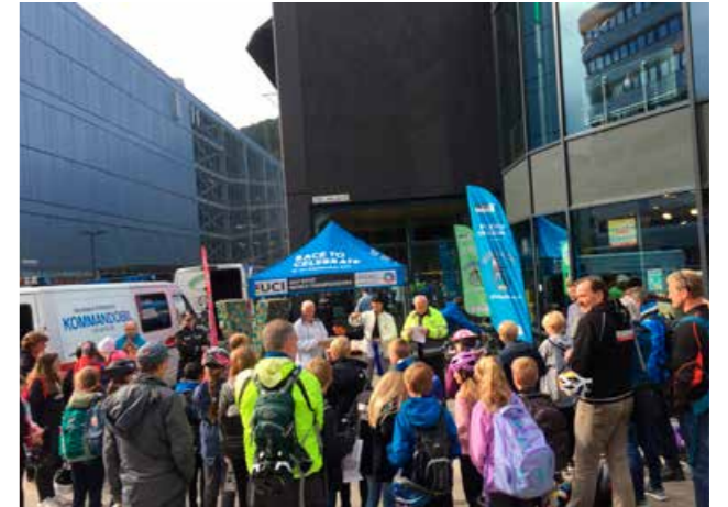
Sykkelfinale for barnetrinnet, halvanna veke før Sykkel-VM!

på ti barneskular med svært gode tilbakemeldingar frå lærarar og rektorar. Utover andre halvår av 2017 vart det også gjennomført vervekampanje for barnehagane, med tanke på medlemskap i Barnas Trafikkklubb. Etter tidlegare gjennomførte barnehagekampanjar i samarbeid med FTU og vervekampanje i regi av Trygg Trafikk frå 2016 fram til årsslutt 2017, er talet på medlemmer i Barnas Trafikkklubb no 221 barnehagar i Hordaland. Dette svarer til i overkant av 40 prosent av barnehagane i fylket. Med tanke på ambisjonar for talet på medlemmer og nasjonale måttal ligg me dermed godt an, og nye kampanjar vil verta gjennomførte i tråd med planar og føringar.