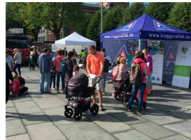
Trafikksikringsdagen 26. august 2017 på Festplassen i Bergen.

På vårparten vart det mellom anna gjennomført årsmøte i stiftinga Ettetankens dag, kursdagar i Stjørdal, workshop om nytt investeringsprogram for fylkesvegane, planlegging av fagdag sykkel, møte med Røde Kors om samarbeidsprosjekt, deltaking på den nasjonale ts-konferansen og Øst-Vest-konferansen, samarbeid om tunneløving for naudetatane og ulukkesdemonstrasjon for russen i Hardanger. Det vart også arbeidd grundig med ei eiga fråsegn om E16 i samband med revidering av Nasjonal transportplan, i tett samarbeid med Norges lastebileierforbund, Vestnorsk transportarbeiderforening og NAF avd. Bergen og omegn. Arbeidet resulterte i eit felles utspel overfor transport- og kommunikasjonskomiteen, og fleire mediesaker og lesarinnlegg med krav om ny E16 med bakgrunn i ulukkestal og trafiktryggleiksstoda langs strekninga. På vårparten vart det elles gjennomført ei sikring av barn i bil-teljing i samarbeid med UP, i samband med TISPOL-veka deira. Teljingane syner at fleire foreldre sikrar barna sine