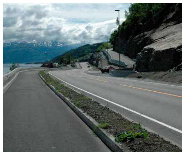
Fylkesveg i Hardanger.

ein mann i Samnanger, ein mann i Kvam herad, ei kvinne i Tysnes kommune og ei kvinne i Bømlo kommune. Det vil seia at av elleve omkomne er åtte menn og tre kvinner. Den yngste av dei omkomne var 18 år, mens den eldste var 81 år.