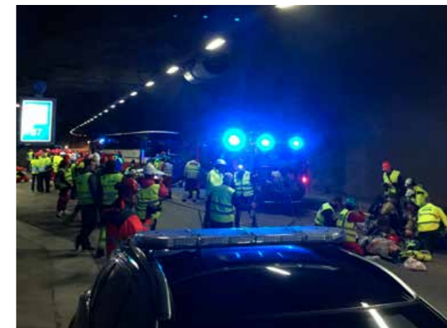
Tunneløving for naudetatane og ulukkesdemonstrasjon for russen i Børvenestunnelen.

bakovervendte, og at det er færre som sikrar barna sine feil. Nasjonalt sit no 63 prosent av barn mellom 1 og 3 år bakovervendt. Likevel viste resultatane frå Rogaland, Sogn og Fjordane og Hordaland at me her på Vestlandet ligg dårlegast an i høve til landet elles, med 53 prosent barn i alderen eitt til tre år sikra bakovervendte. Det viser eit behov for vidare innsats. Teljingane og resultatane fekk fleire medieoppslag, med argument for kvifor bakovervendt sikring av barn i bil er viktig. Eitt tiltak som er gjennomført i 2017, er etablering av stand i Trafikksikkerhetshallen i samarbeid med stiftinga bak hallen og ATL. Det er kjøpt inn utstyr og monitor i hallen, slik at det kan synast filmar om rett sikring av barn i bil for relevante målgrupper i hallen.