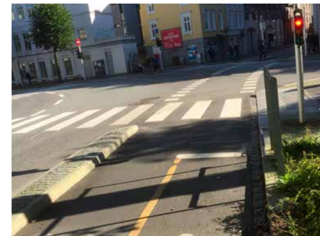
Sykkelveg i Bergen sentrum.