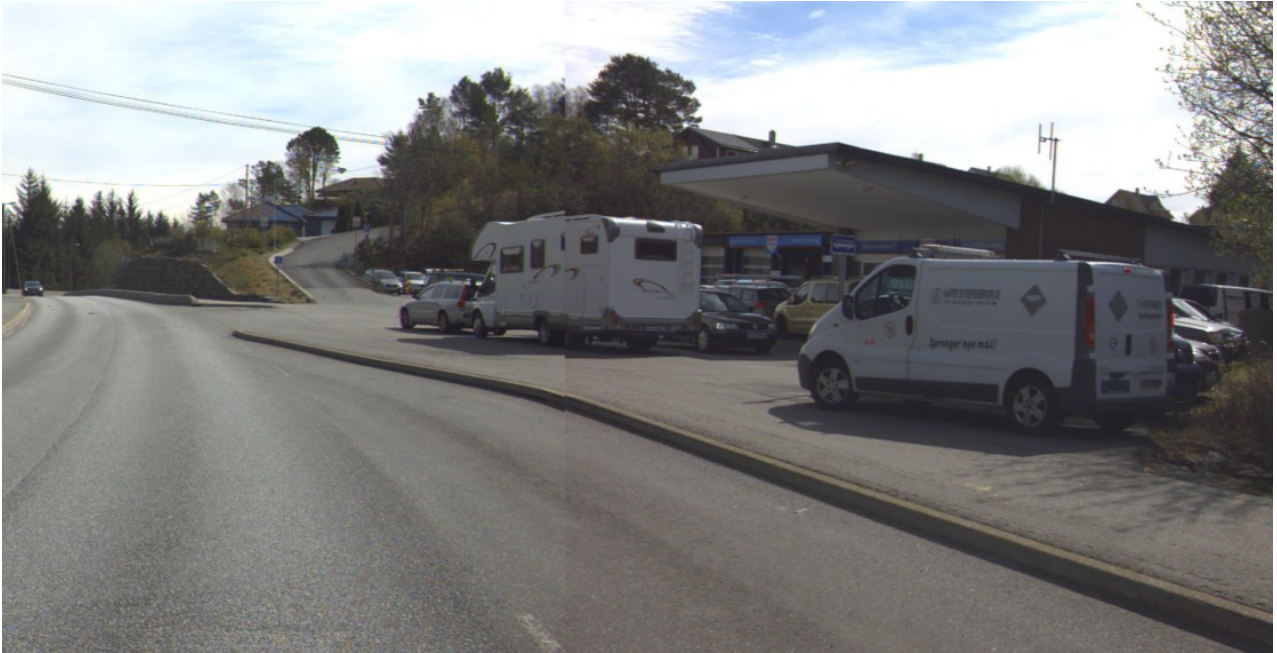
FV233 HP 1 Km 1,130 – mai 2017

Vegvesenet har gjennom sin saksbehandling gjort en konkret vurdering av forholdene ved det aktuelle avkjørselspunktet. Løsningen som ble opparbeidet for 6-7 år siden fungerer ikke tilfredsstillende. I tråd med overordnede nasjonale mål om å øke andelen gående og syklende har vegvesenet de senere [år] hatt et økt fokus på denne trafikantergruppen. Avkjørselen ligger ca. en halv kilometer fra Brattholmen barneskule. Før det åpnes opp for videre utbygging i området bør dette potensielle ulykkespunktet utbedres.