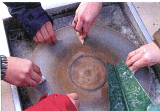
Mostramarmor kan bli fine smykke!

Styret har hatt 9 styremøte i 2017 og samarbeidet i styret har vore godt. Det føreligg underteikna referat frå alle styremøta.