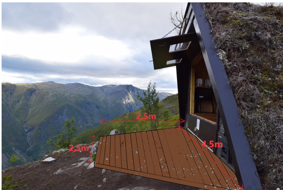
Gapahuken med innteikna terrasse. Foto frå søknad.

Det vert i tillegg søkt om 4 landingar med helikopter for å transportera materiale til terrassen. Det vert søkt om å få transportert ved til gapahuken saman med materialtransporten.