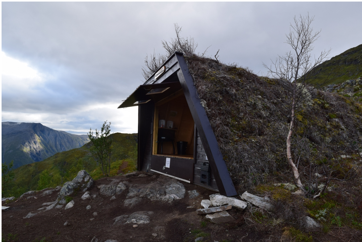
Gapahuken med inngangsparti.

mindre innbydende ut. Det vert søkt om å få sette opp ein platting av terrassebord for å få ein reinare og finare uteplass. Steinen fremst på kanten ynskjer dei å hogge av, slik at den ikkje kjem i konflikt med terrasseborda. Plattingen er tenkt å ha ei trekantform med 4,5 meter breidde bak, 2,5 meter brei i front, og 2,5 meter breidde ut frå veggan (sjå bilde under).