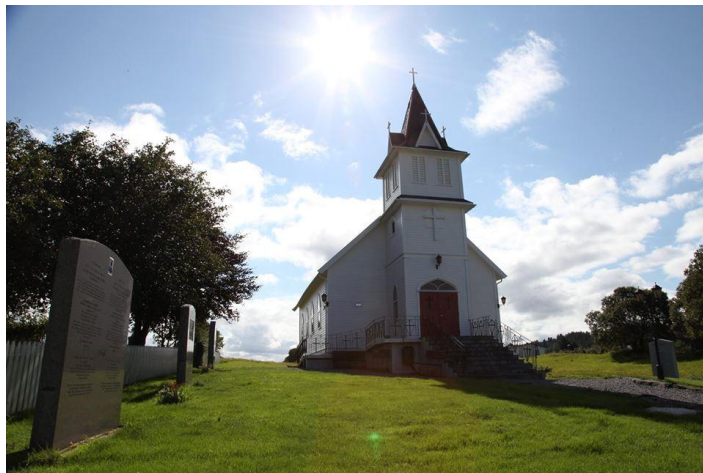
Emigrantkyrkja på Sletta

Hordaland fylkeskommune har den gleden av å tilby 17 framсыningar i Hordaland fylke med «Migrasjon – tonane dei bar med seg over havet». Premieren var den 11. februar 2018 på Sletta i Emigrantkyrkja, og etter det la ensemblet ut på turné med åtte framсыningar på ulike stadar i Hordaland. Våren 2018 har dei ei ny-premier i USA, Seattle. Hausten 2018 går neste turné av stabelen.