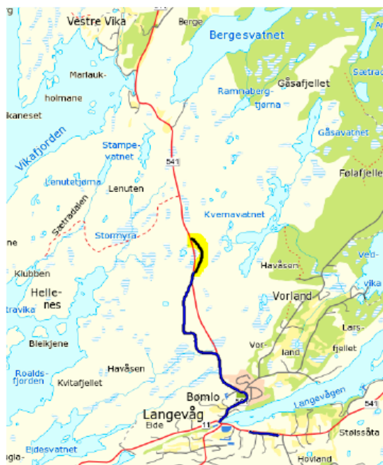
FG. 541 hp 5 km 3,820 – 4,201, lengde 381 meter