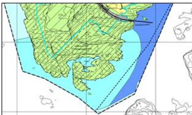
Kartutsnitt: Kommunedelplan Rongøy.

I høyringsdokumentet «Kommunedelplan Rongøy – planrapport med konsekvensutgreiing», står det under overskrifta «Rådmannen sine kommentarar til merknaden i høve til planforslaget datert 2012: