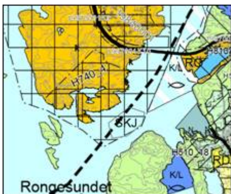
Kartutsnitt: Kommuneplanen sin arealdel.

Ifølgje høyringsdokumenta skal kommunedelplan Rongøy, som er på høyring, erstatte gjeldande kommuneplan (2014) for det geografiske området den gjeld. Plankartet i gjeldande kommuneplan (2014-2022) viser eit område med førsteprioritet for masseuttak skjelsand (SKJ) i Rongesundet. På området er det ein eksisterande skjelsandkonsesjon, men området er ikkje lenger vist på plankartet til kommunedelplan Rongøy, sjå kartutsnitt frå begge planane nedanfor.