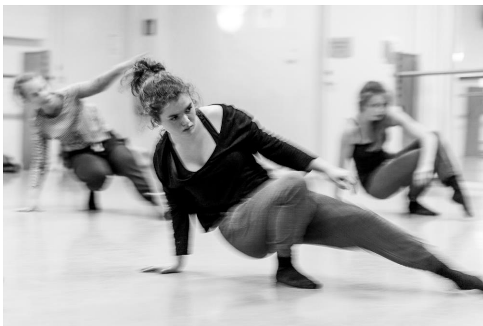
Fra danseklassen.

-BDS deltok i desember på Hordaland fylkeskommunes innspillsmøte om ny kulturmelding for fylket.