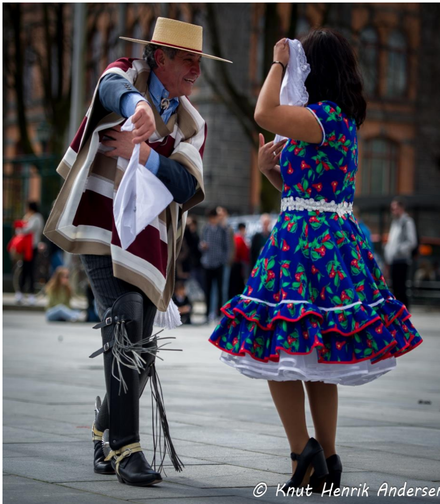
Dansens Dager på Festplassen. Dansegruppen Cuecas (Chilensk folkedans)

Arrangementet møter stor velvillighet hos Bergen kommune både i kulturavd. og i Grønn Etat.