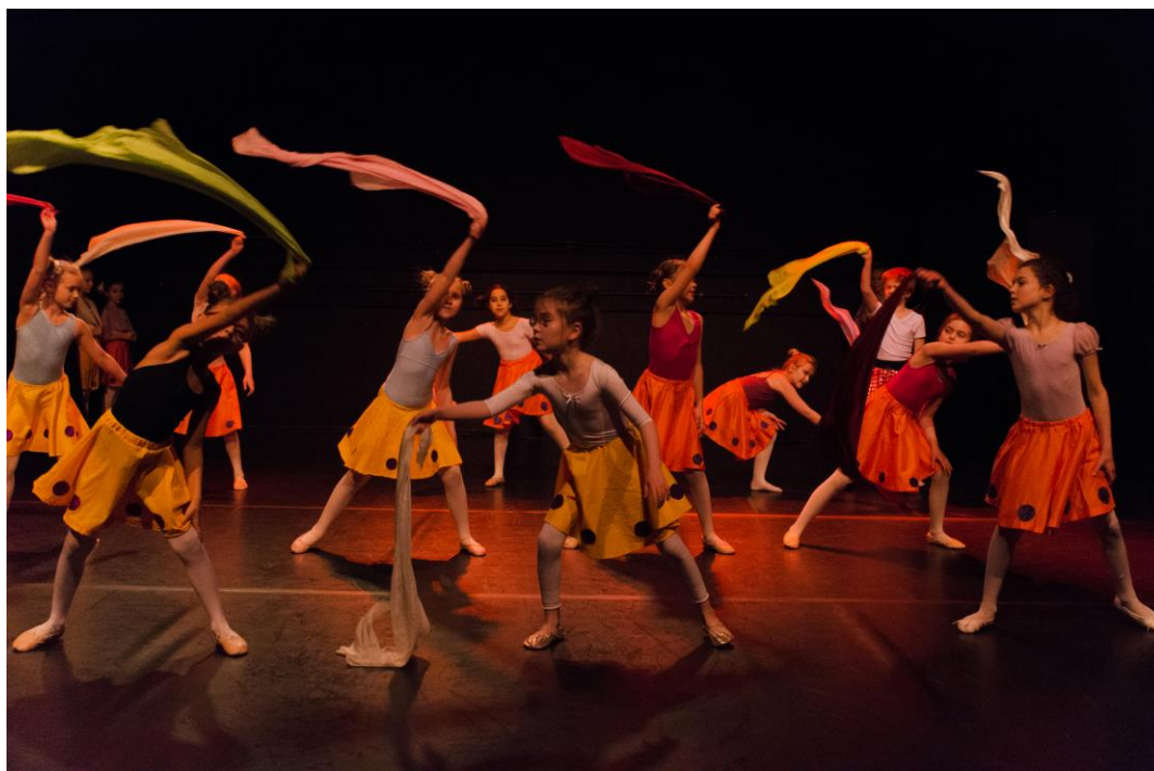
Fra Juleforestillingen 2017.

BDS arrangerte i samarbeid med RAD – Royal Academy of Dance, 2-dagers workshop i ballett med den anerkjente pedagogen/danseren Darren Parish. Workshopen samlet 26 danseelver fra ulike danseskoler både i Hordaland og Sogn.