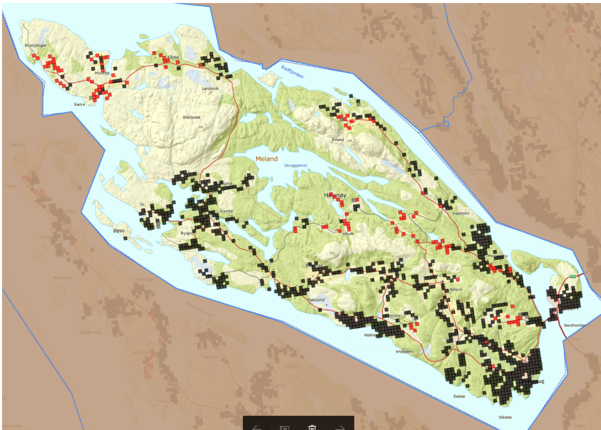
Dekningskart under 10 Mbit/s