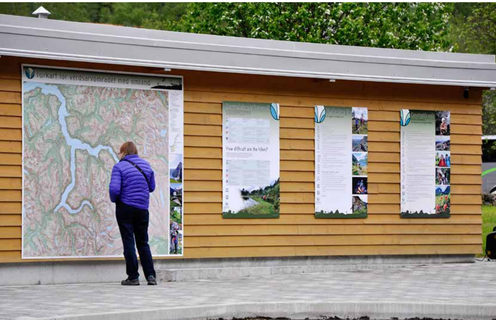
Kart- og skilttavler vart sett opp på toalettbygget ved Fjordsenteret i 2017.