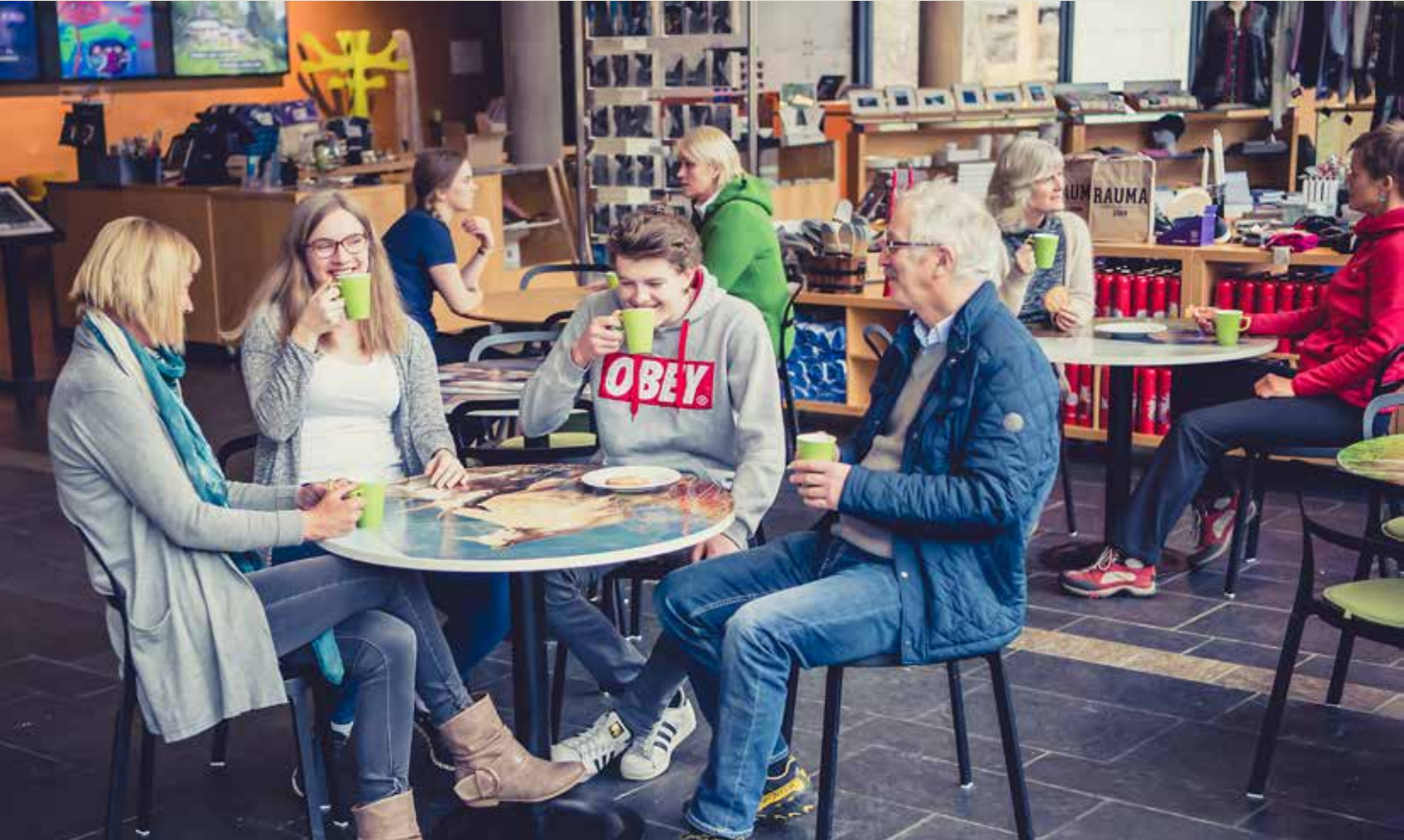
Norsk Fjordsenter er autorisert som Besøkscenter verdsarv og tilbyr varierte utstillingar, butikk og kafé.