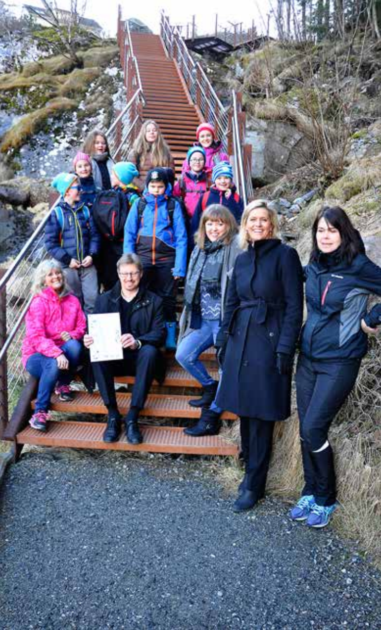
Lyssetjing av Fossevandringa. Gåve frå Sparebanken Møre.