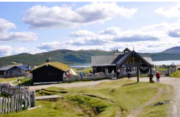
Årets strategisamling vart lagt til Brimistugu i Lom.