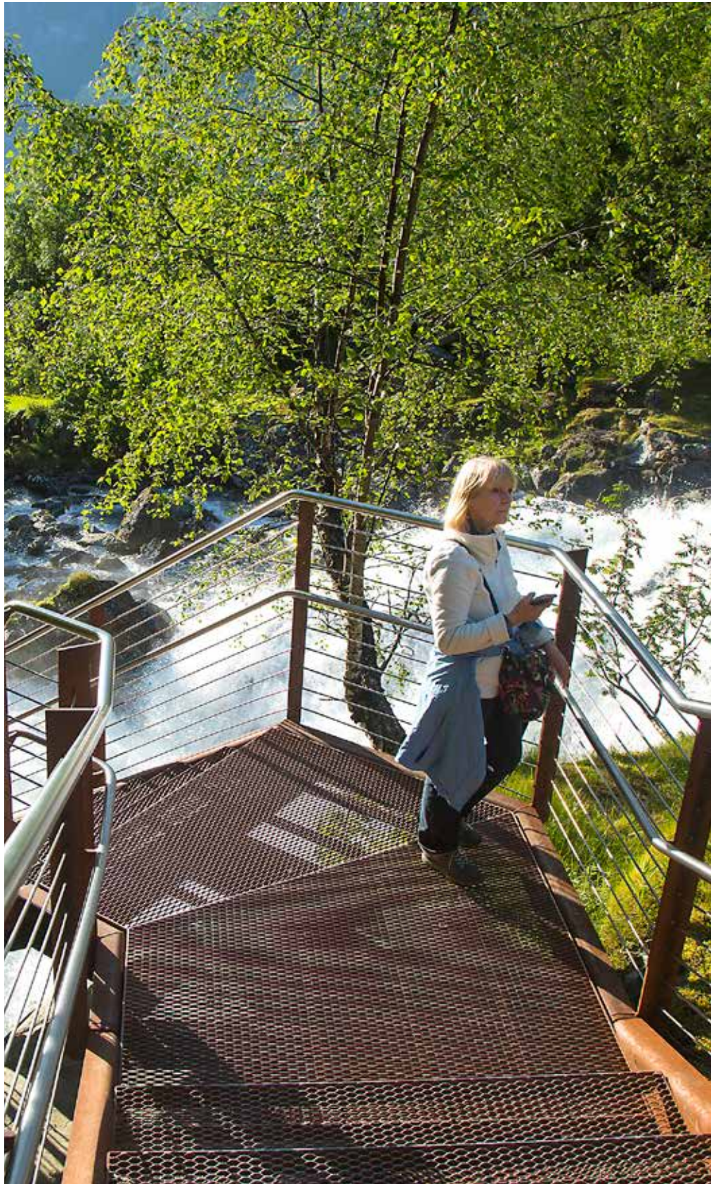
Fossevandringa opp til Fjordsenteret er ei fin oppleving og ein kjekk aktivitet.

I tillegg til det nemnde arbeidet, sel Stiftinga rekneskapstenester til Storfjordens Venner.