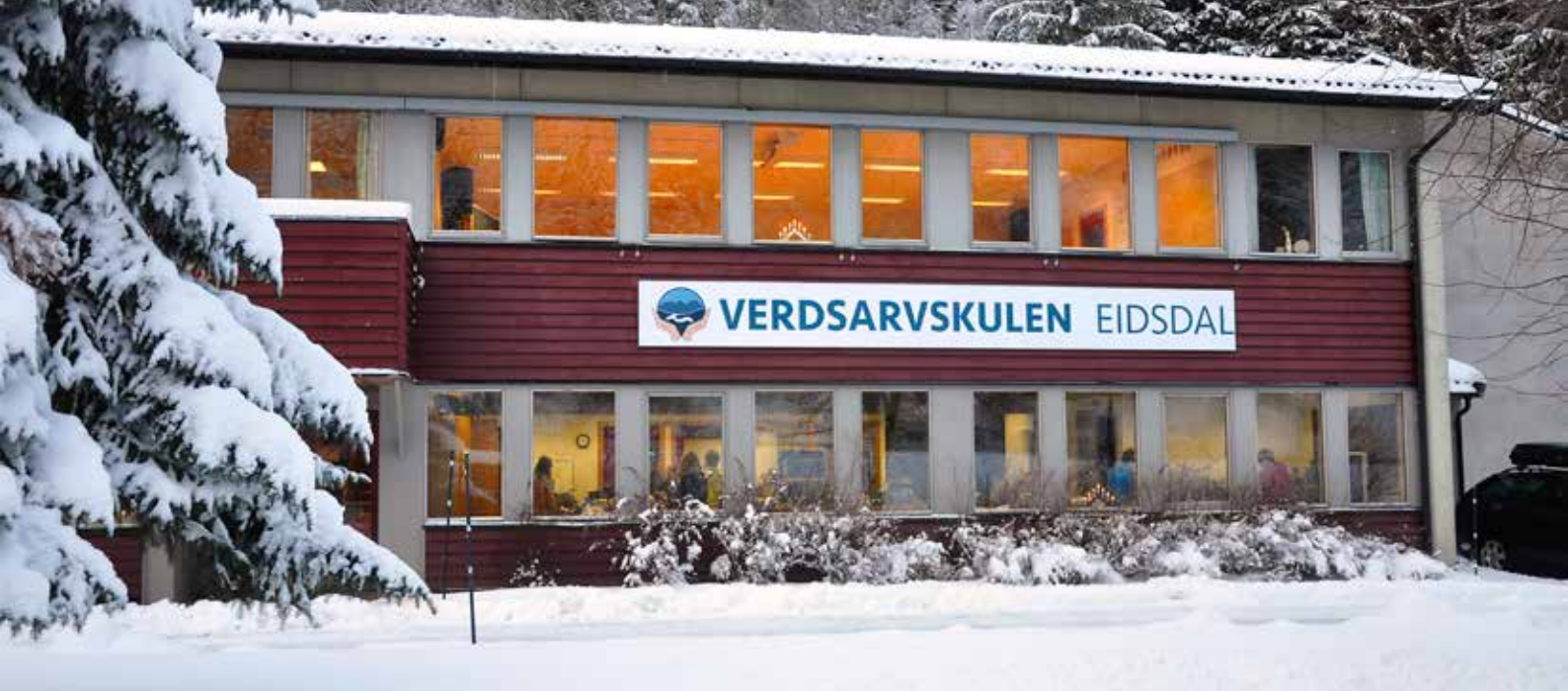
Verdsarvskulen i Eidsdal.