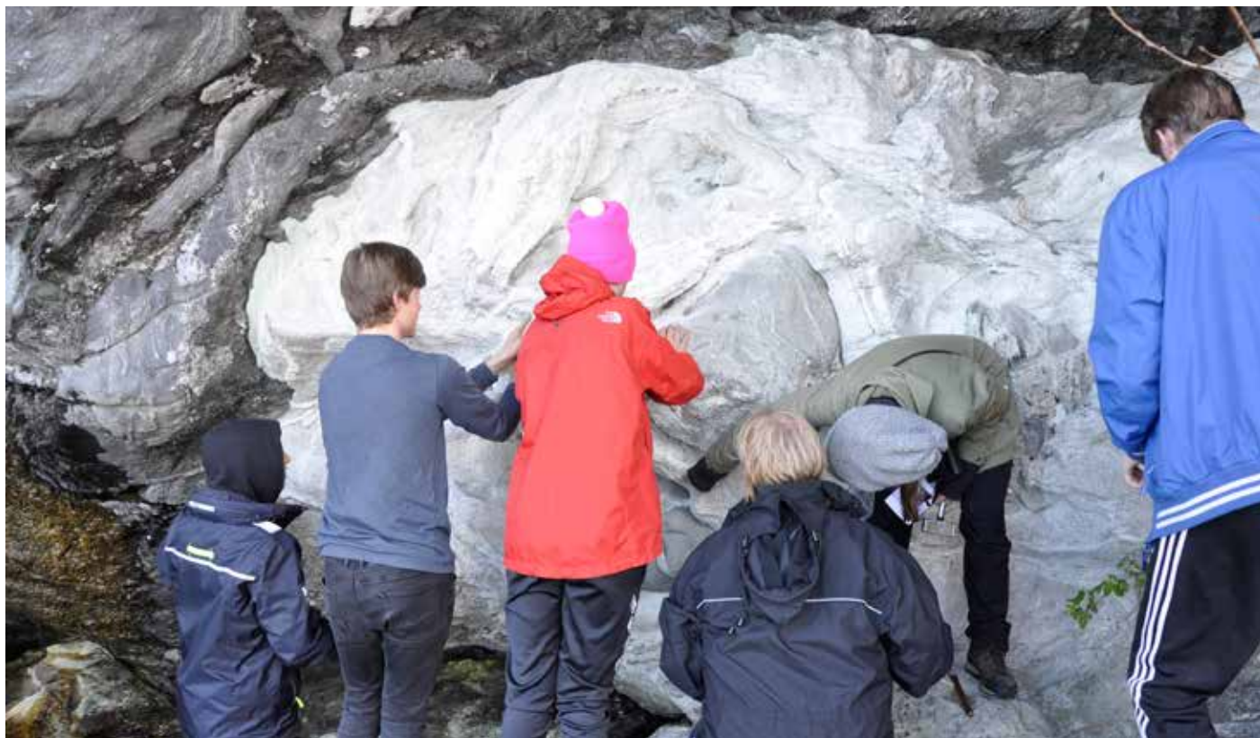
Skuleelevar på ekskursjon til Blautgrjothola ved Eidsdal saman med geolog frå UiB.

Fjordsenter og fekk formidla kunnskap om landskap, landskapsformer og korleis landskapet vert til.