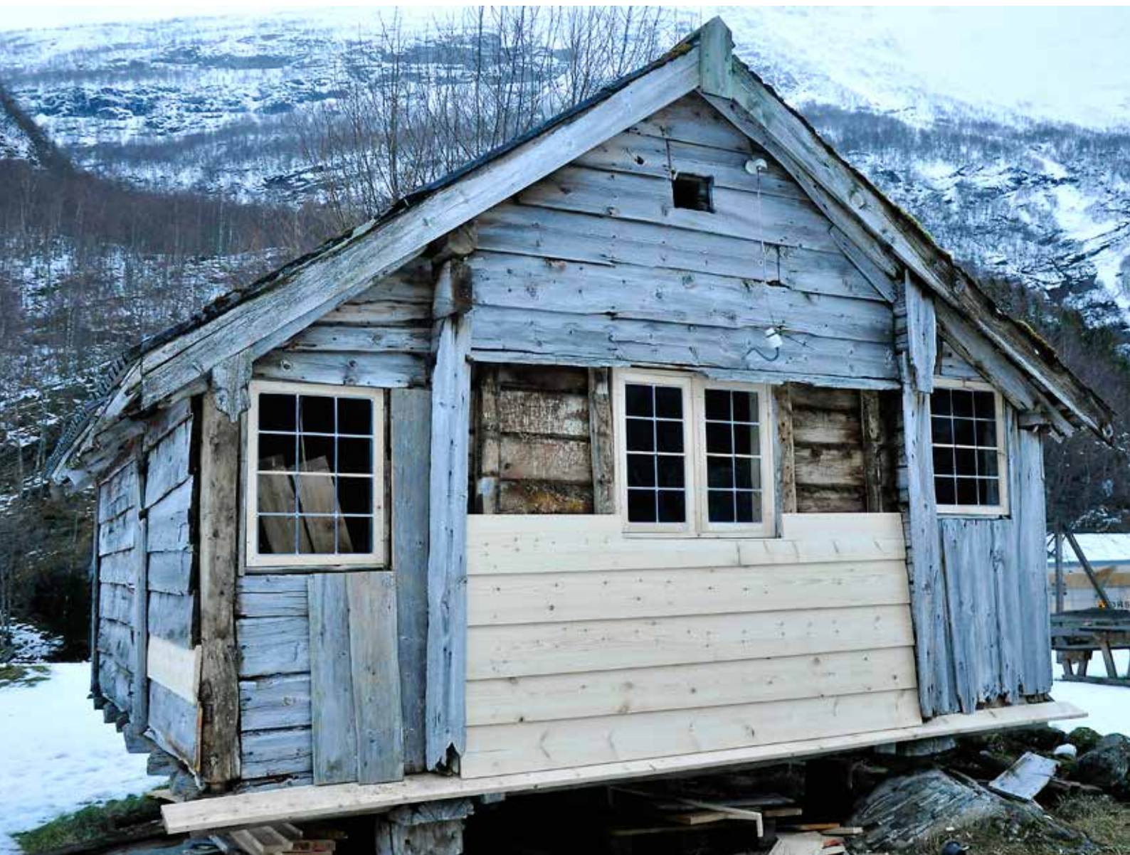
Istandsetjing stabbur på Norsk Fjordsenter.