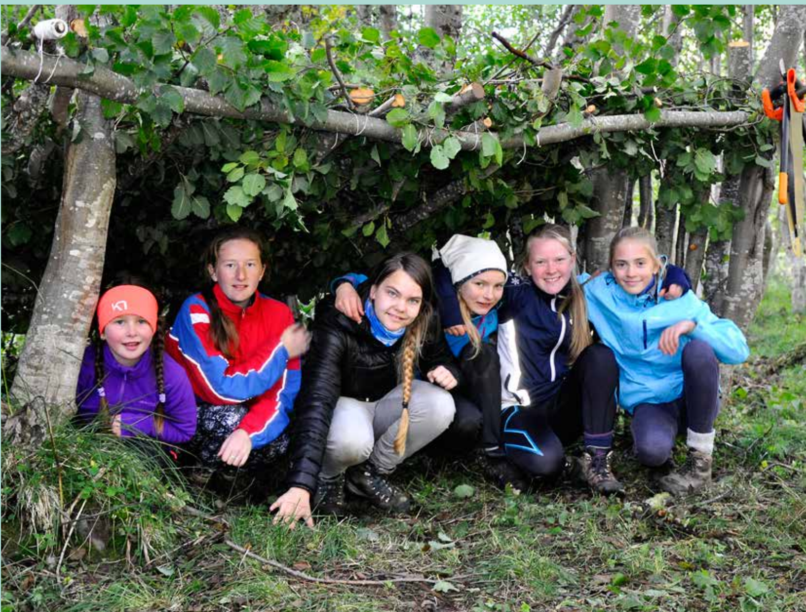
På friluftscampen i Herdalen bygde borna gapahuk.