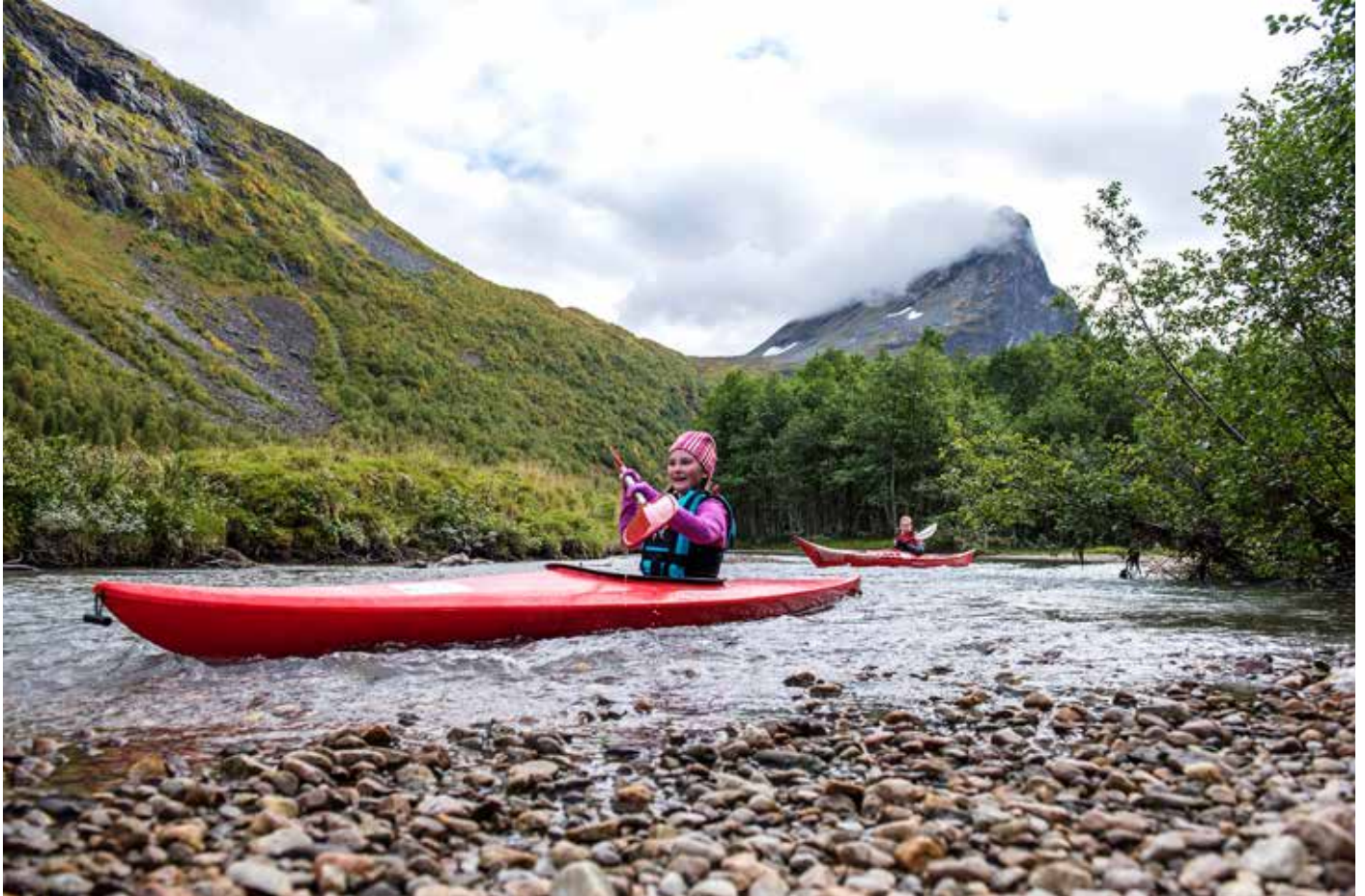
Padling var ein av aktivitetane på friluftscampen i Herdalen.