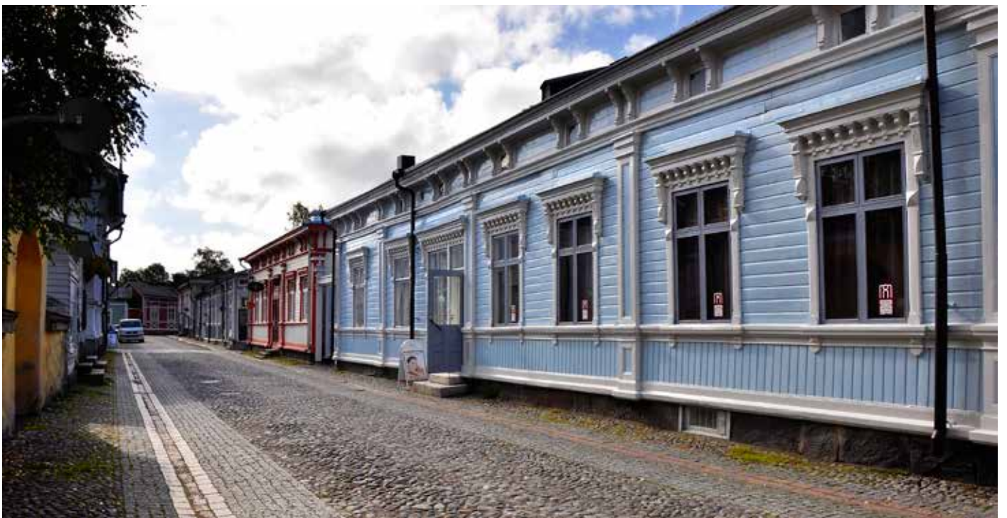
Nordiske Verdsarvkonferanse vart arrangert i Rauma, Finland i 2017. Her frå gamlebyen som står på Unesco si verdsarvliste.