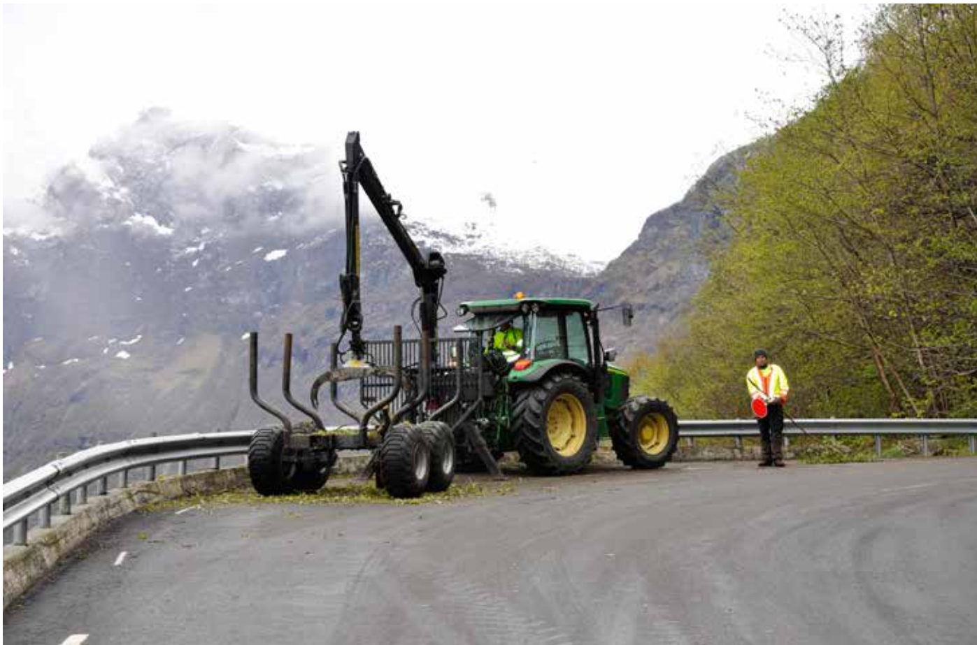
Utsiktsrydding ved Ørnevegen.

Stiftinga inngjekk avtale med grunneigar og tok ansvaret for å få opp stenderar og kjetting som folk kunne halde seg i ved ferdsel i Skagehola. Det vart òg gjort nokre utbetringar på rekkverka lenger oppe langt råsa til Skageflå. Eidsdal Bygdesørvis stod for arbeidet.