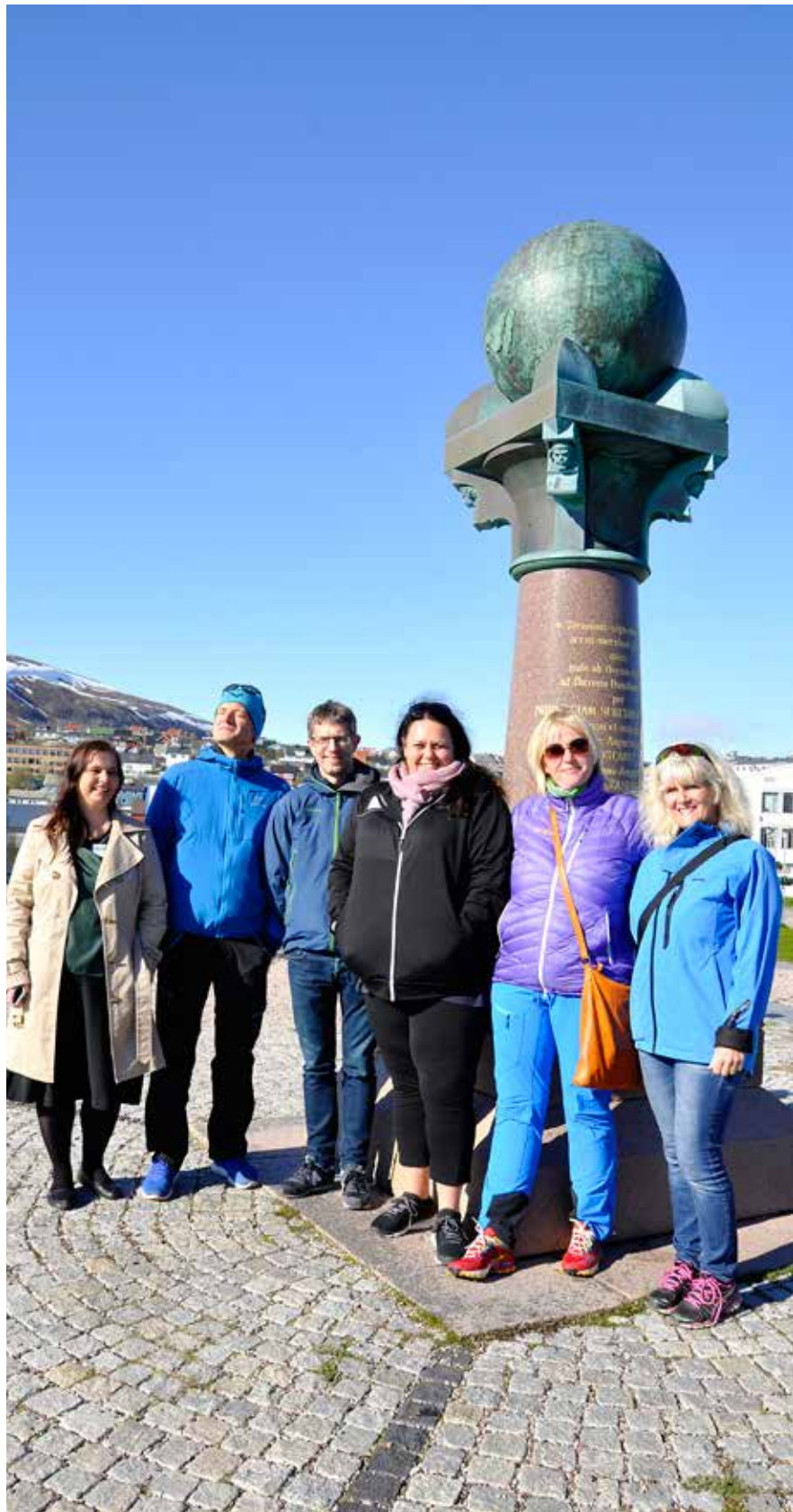
Verdsarvforum i Hammerfest. Delegasjonen frå Vestnorsk framfor Meridianstøtta.

Stiftinga Geirangerfjorden Verdsarv vart sertifisert som Miljøfyrtårn i 2014. Det er hausten 2017 gjennomført eit arbeid med resertifisering med godkjenning tidleg i 2018.