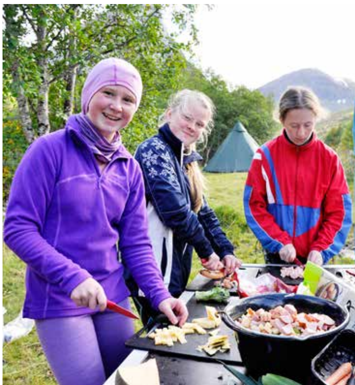
Friluftscamp i Herdalen.