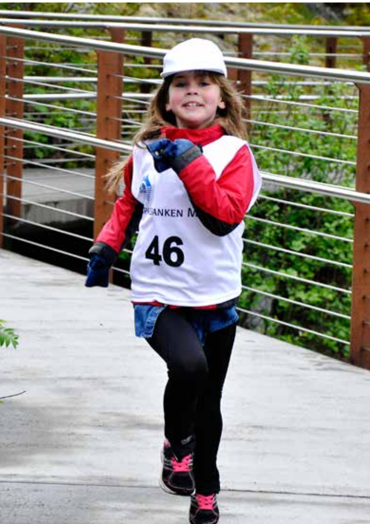
God deltaking og flott stemning under Fosseløpet.

Vi arrangerte bygdemøte i Valldal og Eidsdal på haustparten. På begge møta orienterte vi om arbeidet til Stiftinga med hovudfokus på område som var relevante for folk