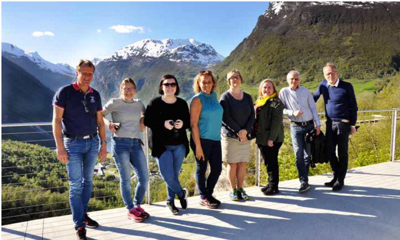
Besøk frå Vegaøyen Verdsarv.