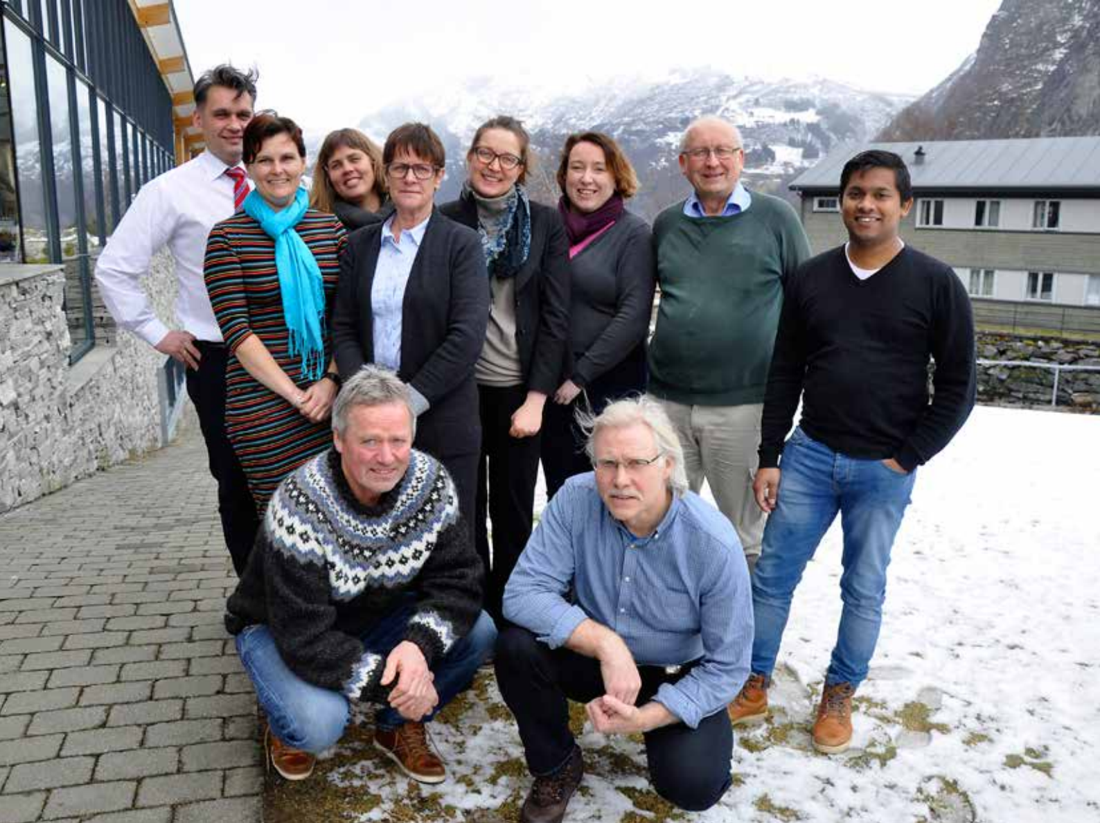
Styringsgruppa for Grøn fjord 2017-2018