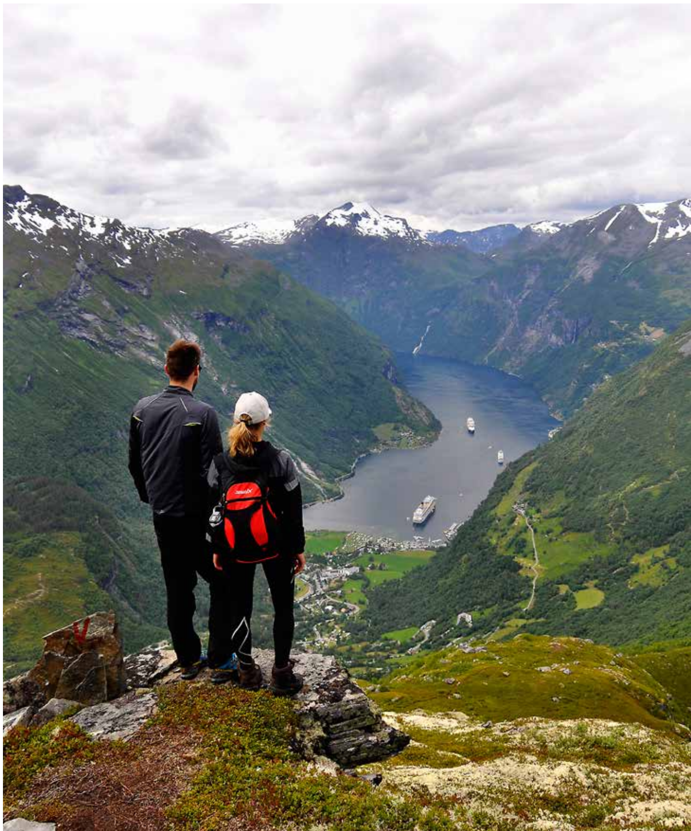
Frå fjellturen over Vinsåshornet sommaren 2017.