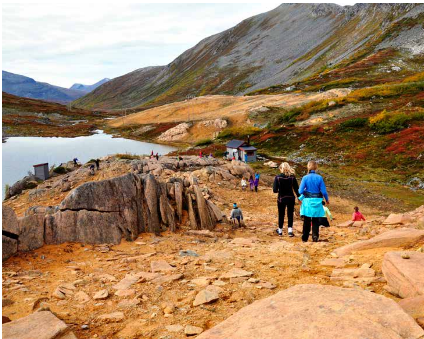
Det vart arrangert fellestur til Kallskaret i samband med Friluftscampen.