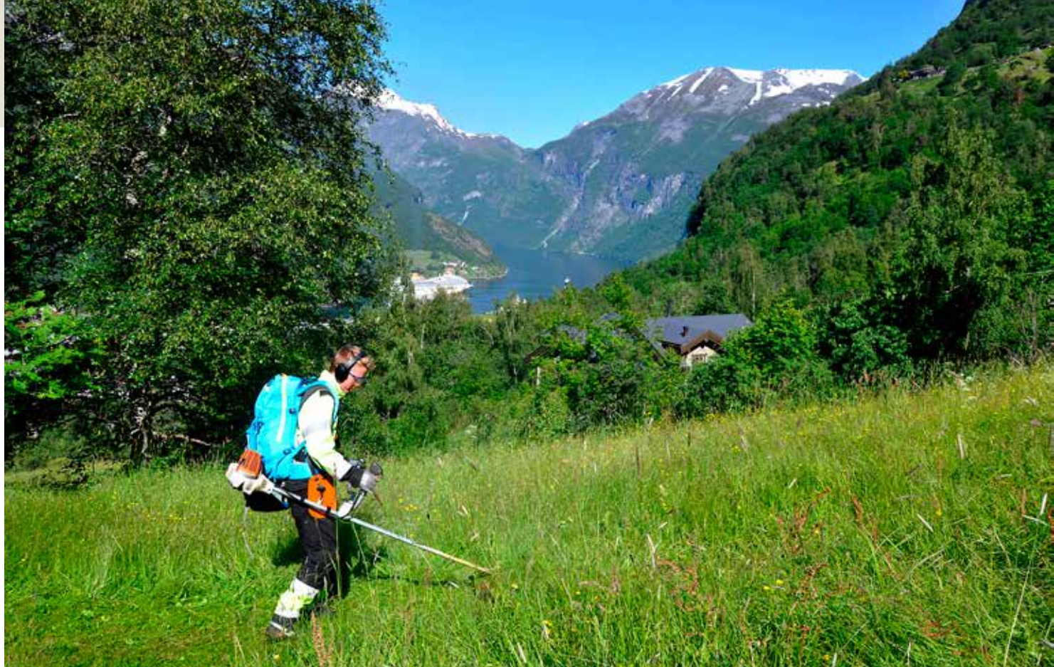
Råsrydding i Geiranger.