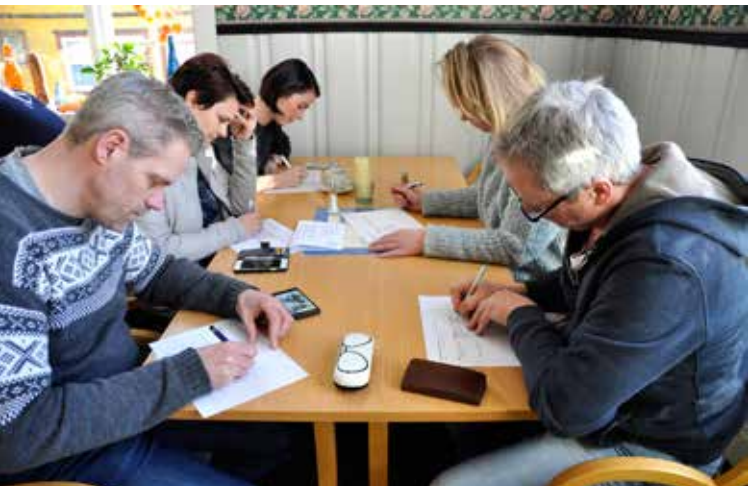
Gruppearbeid på partnerskapsamling i Grøn Fjord rørsla.