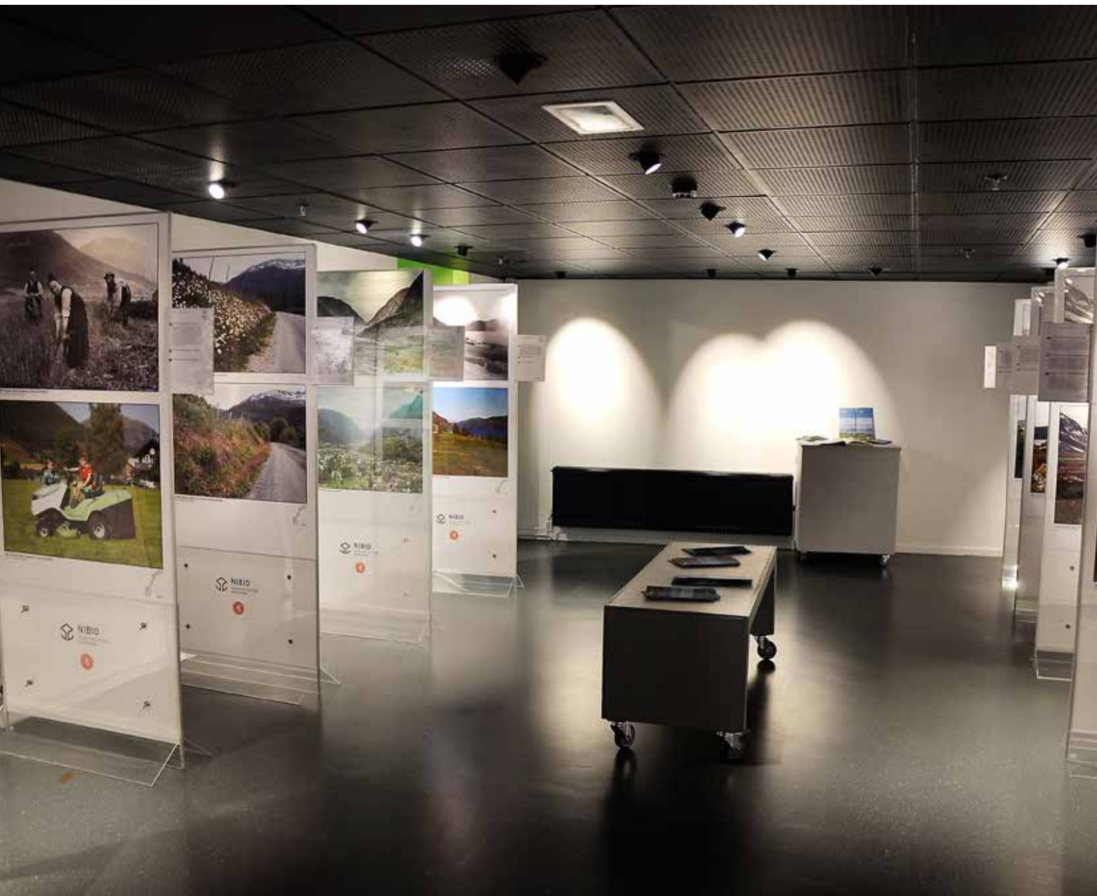
Frå utstillinga "Landskap i endring".