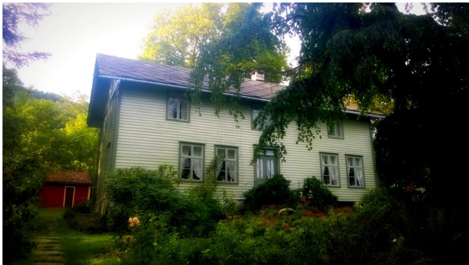
Kinck –garden

Tangerås, Strandebarm (gnr 121 bnr 3) – tun med våningshus i sveitserstil (Kinckhuset), eldre eldhus, bu og skule i eit heilskapleg kulturlandskap