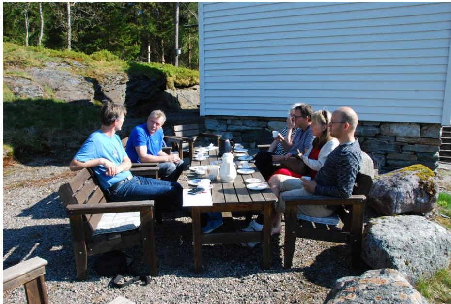
Frå arbeidet med kulturminneplanen –synfaring på Nestunet

H.I. Vik 1994. Garden og bygda. Kulturminne frå Øystese i Hardanger . Øystese: Friske tankar.