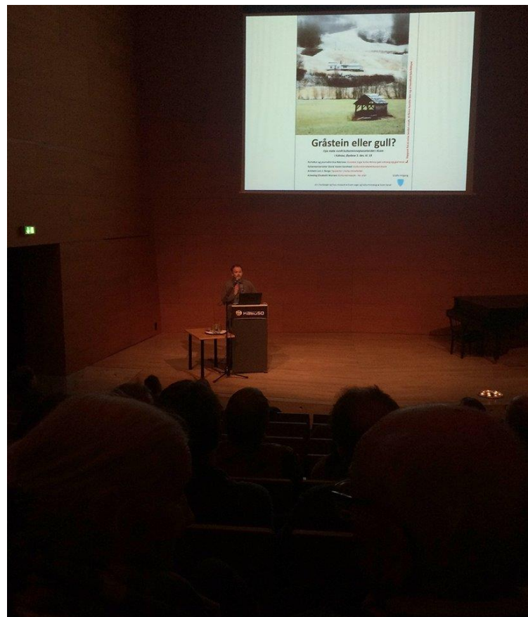
Frå oppstartskonferansen i Kabuso.

Planprosjektet har hatt fellesmøte med alle grendeutvala, og planarbeidet har vore hovud- eller deltema på ulike offentlege møte gjennom planperioden. Det vart oppretta ei facebook-gruppe for planprosjektet. Denne fekk kring 450 medlemmer, og her vart det på uformelt vis posta innspel og meiningsytringar. Det har òg kome innspel over telefon, e-post og gjennom meir uformelle møte. Alt i alt har det vore eit relativt stort folkeleg engasjement for kulturminneplanarbeidet.