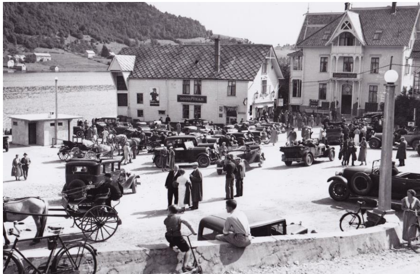
Frå Haldeplassen –Norheimsund sentrum (frå Kvam herad sitt arkiv)

I det tradisjonelle samfunnet hadde familie, slekt, gard og grend vore rammene for sosial omgang og fellesskap. Men i andre halvdel av 1800-talet vaks det fram eit omfattande foreiningsliv, og det vart bygd eit stort tal forsamlingshus rundt i bygdene. Foreiningane representerte noko nytt, og dei samle folk på tvers av gamle einingar som bygder, grender og gardar. Ettersom medlemmane vart samansveisa i ei foreining, fekk dei eit fellesskap og eit ansvar for kvarandre som gjekk på tvers av tradisjonelle sosiale grenser. Organisasjonar som frilyndt ungdomsrørsla, avhaldsrørsla, lekmanrørsla, skyttarlag, idrettslag og politiske parti førte til nye omgangsformer og nye måtar å handle og tenke på. Sosiale kløyvingar i bygdesamfunnet kom også til uttrykk i det nye organisasjonslivet, til dømes mellom lekmanrørsla og ungdomsrørsla. Lekmanrørsla hadde tyngdepunkt i dei ytre bygdene i Hardanger, ungdomsrørsla i dei indre.