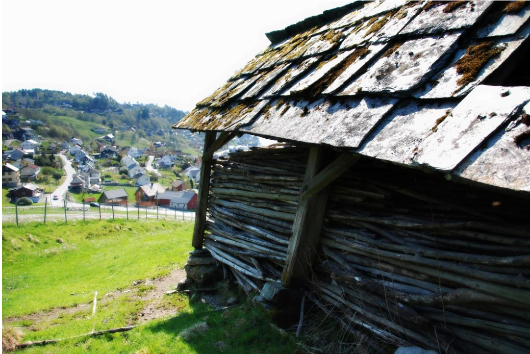
Troskykkje på Norheim.

Stølsdrift er eit godt ivareteke tema i det lokalhistoriske arbeidet i Kvam, og det føregår stadig merking og skildring av stiar og ferdsleveggar i fjellet. Som kulturminnekategori kan me seia at stølar og ferdslevegane mellom dei har ein folkeleg status, og også fokus hjå kulturminnestyresmaktene. Likevel kan me sjå at enkelte stølsmiljø taper seg ved at bygg forfell eller at det vert gjort uheldige inngrep. Stølane sin verdi som kulturminne handlar om arkitektoniske verdiar og stølane som historieforteljar. I tillegg har stølane og stiane framleis ei rolle i landbruksnæringa, og dei er gode arenaer for aktivitet som styrkjer folkehelsa.