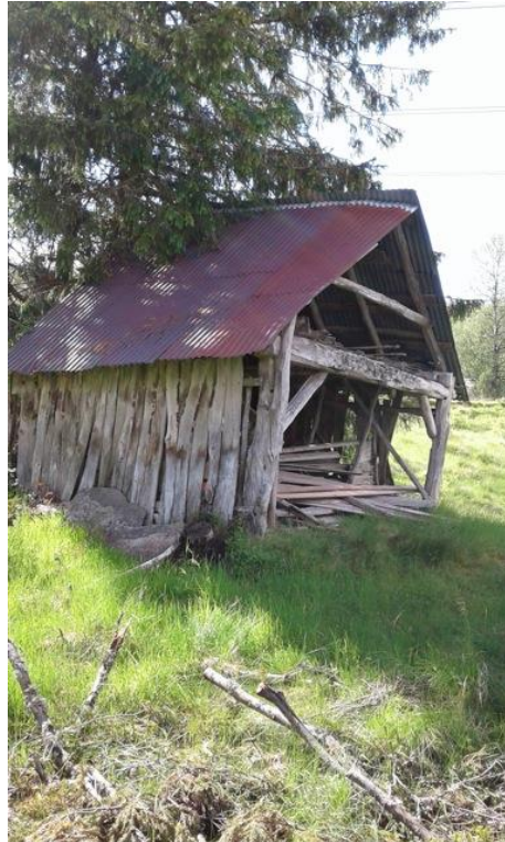
Troskykkje ved Bjørjæ (Tokagjelet).