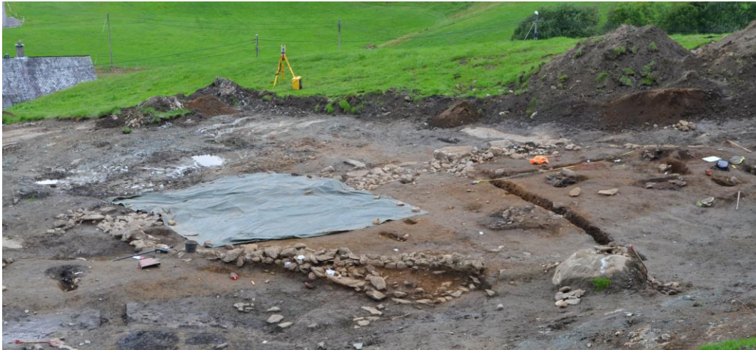
Utgraving av hustuft frå eldre jernalder på i Øvre Øystese

hjelp: stadnamna. Desse kan gje informasjon om busetnadsmønsteret og om når gardane vart etablerte. Namn med ending på -vin- og -heim (Mundheim, Norheim, Sandven, Øystese osv.) reknar ein går tilbake til eldre jernalder eller enda tidlegare. Gardsnamn med namnelekkar som endar på -stad, -land, -tveit og -set(er) har me fleire av, og desse namna vart særskilt brukte i yngre jernalder, frå ca. 600 til 1000.