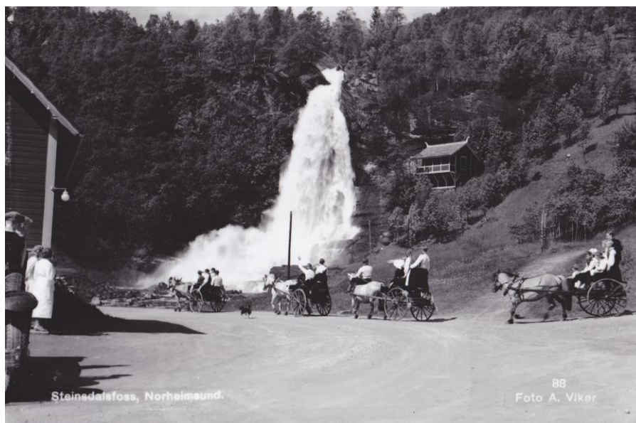
Frå Steinsdalsfossen

27 prosent av yrkesfolkemengda er sysselsett i jordbruk og 39 prosent i handverk og industri. Dei to fremste industrigreiner er primær jern- og metallindustri, som i 1950 gjev arbeid til 381 personar, og møbel- og innreiingsindustrien, som har 180 sysselsette i det same året.