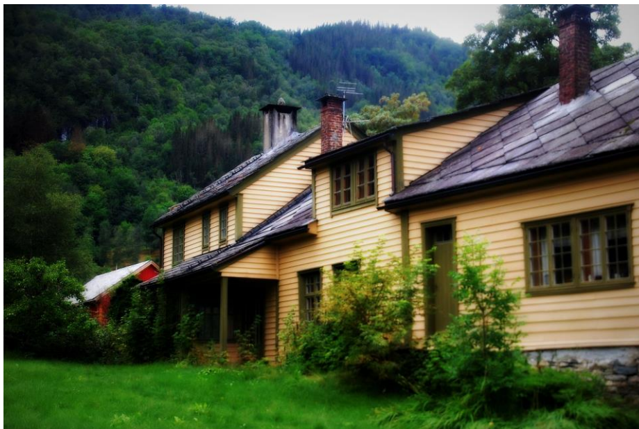
Vikøy prestegard

Når det gjeld kulturminne frå nyare tid som er freda etter vedtak med heimel i kulturminnelova, er det fem slike lokalitetar i Kvam: Ei sengebu frå Vikjo som no står på Tangerås (truleg frå slutten av 1500-talet), ungdomshuset Haugatun i Strandebarm (teikna av Torgeir Alvsaker i 1927), hovudhuset på den gamle kapellan- og offisersgarden Håbrekke (etter tradisjonen bygd kring 1660), samt prestegardane i Strandebarm og Vikøy.