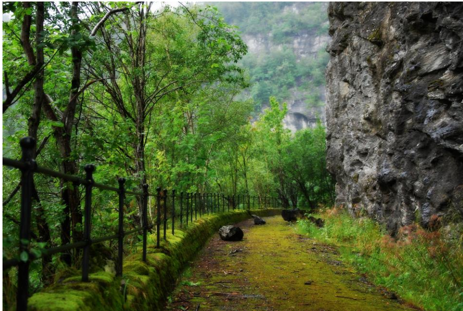
Den gamle vegen i igjennom Tokagjelet (2017).

Vegen gjennom Tokagjelet inngår i landsverneplanen til Statens vegvesen, og han vart freda gjennom forskrift i 2009, som ein 1. generasjons bilveg. Vegen vart bygd i 1907, og ligg i dag som fire skilde parsellar på Rv 7. I ein av tunnelane finst restar etter ei anleggssmie, og på fjellveggen utanfor er det hoggen inn 15 krossar som viser kvar tyskarane underminerte vegen under 2. verdskrig.