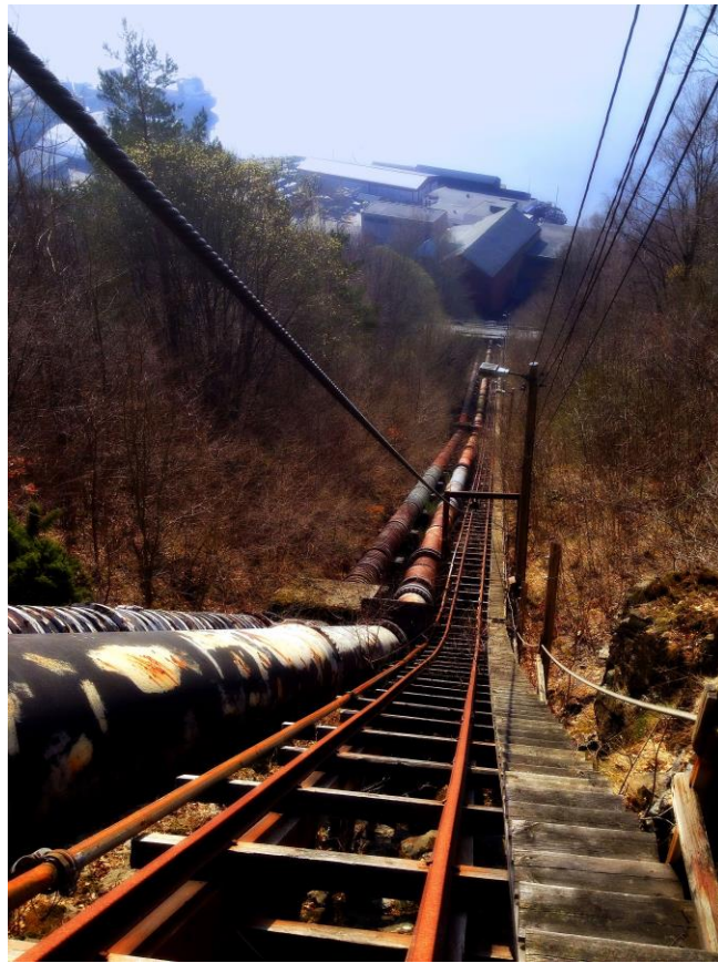
Frå røyrgata til Bjølvefossen

to private handelsforretningane og einaste kafé og pensjonat på staden held til og med til i same hus.