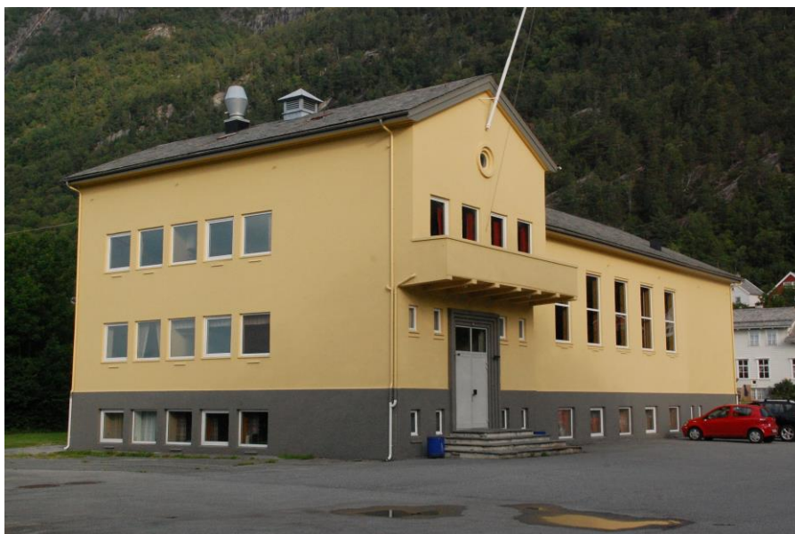
Folkets hus i Ålvik

Songartribunen på Storhaug, Ålvik (gnr 77 bnr 1)