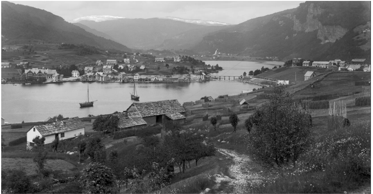
Norheimsund ca 1900.