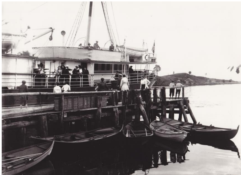
Frå dampskipskaien på Bakka

Dampskipsekspedisjonen på Lundanes (gnr 42 bnr 3)