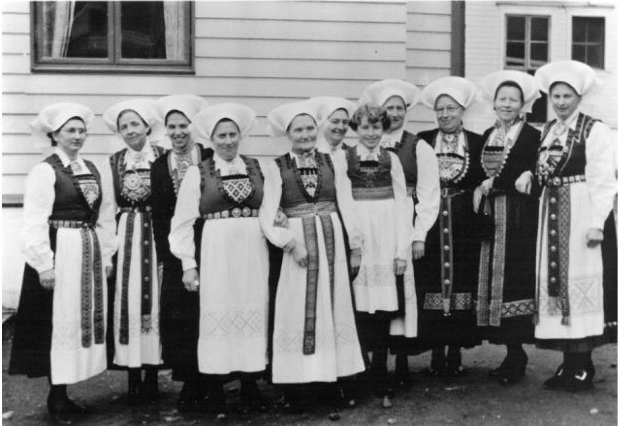
Bunadsklede koner frå Norheimsund utanfor Tingstova, ca 1955.

Hardanger fartøyvernssenter kan kallast eit kulturminne i seg sjølv, men kanskje er det meir rett å seia at dette er ei verksemd som arbeider med og har ansvar for ei viktig samling kulturminne, både materielle og immaterielle. Senteret tek hand om fartøy av ulike aldrar og storleikar, og med ulik grad av verneverdi. I kulturminneplanen er det naturleg å trekkja fram den lokale småbåttradisjonen, og dei ulike handverka som høyrer med i framstillinga av denne.