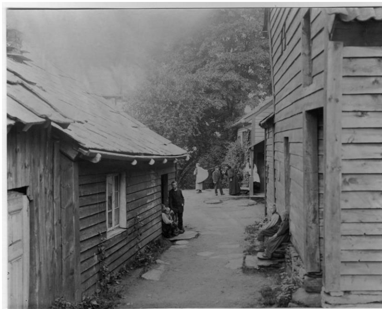
Vikøy prestegard

Det var vanleg å dyrka havre i Kvam, og folk meinte at klimaet i dei ytre delane av heradet ikkje eigna seg godt for bygg. Noko seinare, ut på 1700-talet, vert det fortalt at ein la vekt på husdyrhaldet, og at bøndene i Vikøy helst ikkje ville dyrka opp eng og slått, men heller ville ha mest mogleg beite og flest mogleg dyr, slik at dei kunne selja slaktekveg, smør og kjøt til Bergen, eller over vidda til Kongsberg. Det er kan hende denne spesialiseringa som ligg bak Absalon Pederssøn Beyer sitt utsegn om at «der vanker godt smør, fæ» i Hardanger, og at verksemda soleis er eldre enn t.d. etableringa av Kongsberg i 1624.