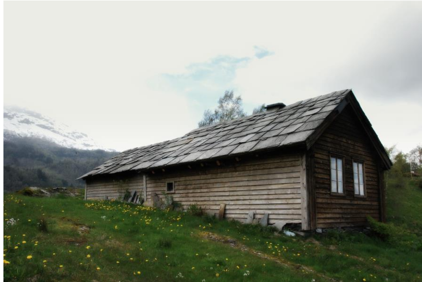
Tørvikbygd bygdemuseum

Nes gard, Norheimsund (gnr 34 bnr 1) – tidlegare lensmannsgard med fleire eldre bygningar