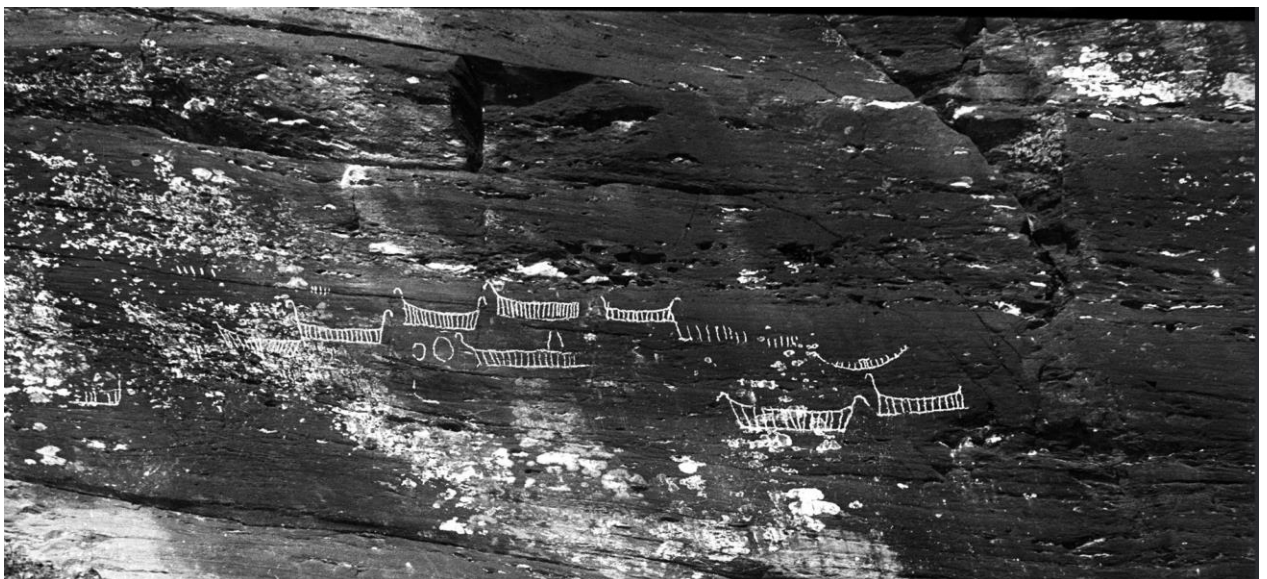
Helleristningar på Ytsheim i Vangdal

Det finst fysiske vitnemål frå eldre steinalder (10 000-4 000 år f.Kr) i Kvam. Ved Salthamaren i Vangdalsberget sette steinalderfolk merke etter seg for 6000 år sidan, eller noko før det. Helleristningane deira syner dyrefigurar, men berre to av dei er no fullstendige. Den eine tykkjest vera ein elg, den andre ein hjort. Her er også eit par menneskefigurar. Fleire tusen år seinare rissa bronsealderbønder inn skipsfigurar i same berga, men nærmare sjøen. Det er uvanleg å finna helleristningar frå heilt ulike tider i same berg. Salthamaren er såleis ei sjeldan historiebok.