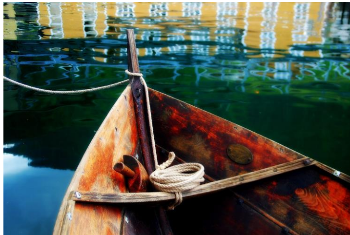
Robåt i frå Hardanger

Inntektene frå ulike attåttnæringar sette fart i moderniseringsprosessen lokalt, og det vart skipa bygdesparebankar. Strandebarm Sparebank var fyrst ute i 1852, medan Kvam fekk sparebank i 1860 og Øystese (Østensjø Laaneindretning) enda to år seinare. Det var særleg fartøynæringa som trong kapital. Til å frakta varene sine den lange vegen til torgs i Bergen, hadde dei meir velståande fjordbøndene tidleg bygd seg større, opne fartøy, og etter kvart var hardangerjakta, eit einmasta fartøy med både gaffel- og råsegl, blitt eit vanleg syn på fjorden. Hardangerjakta var rekna for noko av ein skarpseglar, og med jakter opererte hardingane langs heile kysten. Gullalderen til fraktofarta var perioden 1850-1880, og omkring 1860 høyrde kvart tredje fraktofartøy i fylket heime i Hardanger, mange av dei i Strandebarm og Kvam. Varene var i første rekkje fisk, men også ved, hatleband og stav til tønneproduksjon, frukt, mjølkeprodukt og småbåtar, medan dei tok korn og ulike byvarer i returlast.