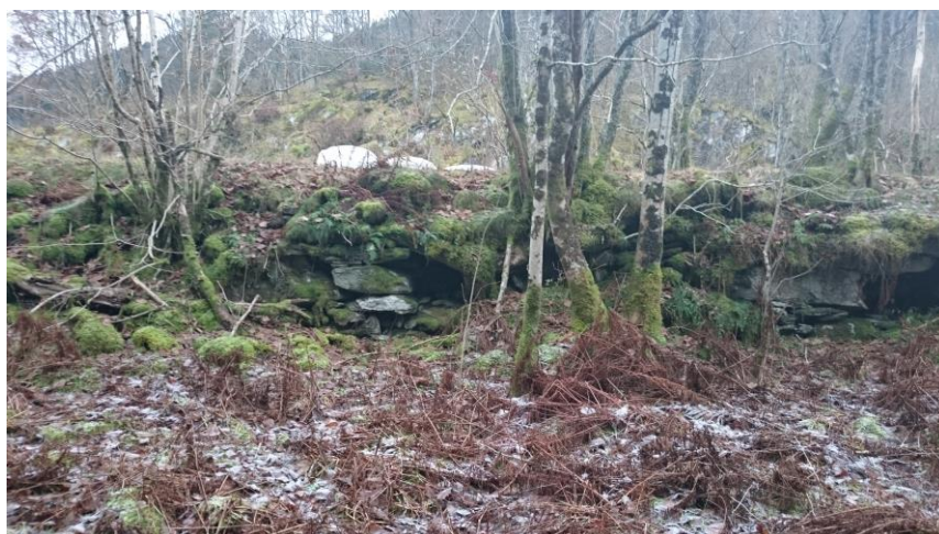
Restar av tomt etter leidangsnaust –Hamn

Kvam av i dag kryssar ei gammal grense mellom Strandebarm og Kvam, frå Tørvikbygd til Torsnes i Jondal. I mellomalderen gjekk grense mellom Hardanger og Sunnhordland sysler her, og seinare var dette skiljet mellom dei to fogderia Hardanger og Søndhordlehn. Kvam hørde til Hardanger, Strandebarm til Sunnhordland. Målføret i Strandebarm fortel tydeleg om det gamle kultursambandet med sunnhordlandsbygdene. Strandebarm og Kvam (Øystese) utgjorde òg to skipreider i mellomalderen. Ei skipreide var eit avgrensa område der innbyggjarane var kollektivt ansvarlige for å byggja, halda, rusta ut og manne eit langskip til bruk i forsvaret av landet. Dei to store nausttuftene som framleis er tatt vare på i kommunen – i Skipadalen på Valland og på Hamn i Dysvik – meiner ein har vore leidangsnaust i kvar si skipreide. I leidangssystemet inngjekk vidare vetane, som vart tende når fiendtlege skip nærma seg kysten. Bjørkeveten stod i samband med veten på Oksen i aust og veten på Vitefjellet i Varaldsøy i vest.