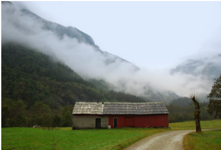
Botnen –inst i Fykkesundet.