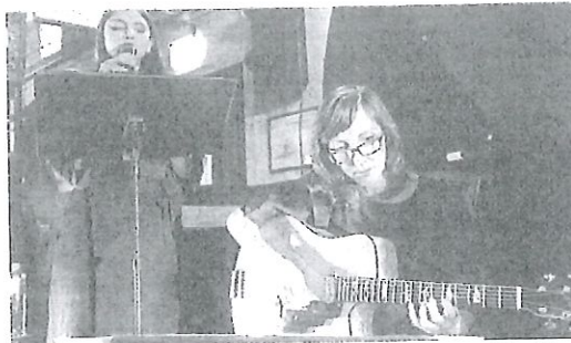
PÅ LIV OG DØD: Mary Halvorson ser kanskje ikke ut som en klassisk gitarhelt, men hun spiller som om hver tone handler om liv og død.

Sammen med et knippe kortreiste musikere blir den gamle folkemusikken lett oppjazzet og tilførte en moderne tonedrakt. Vakkert,