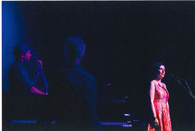
Vossa Jazz